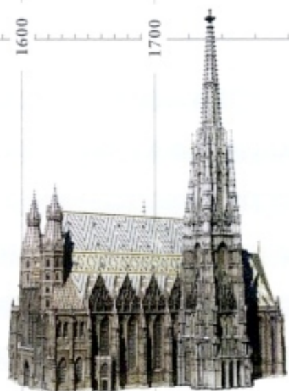
1359 Grundsteinlegung für das gotische Langhaus des Stephansdoms.