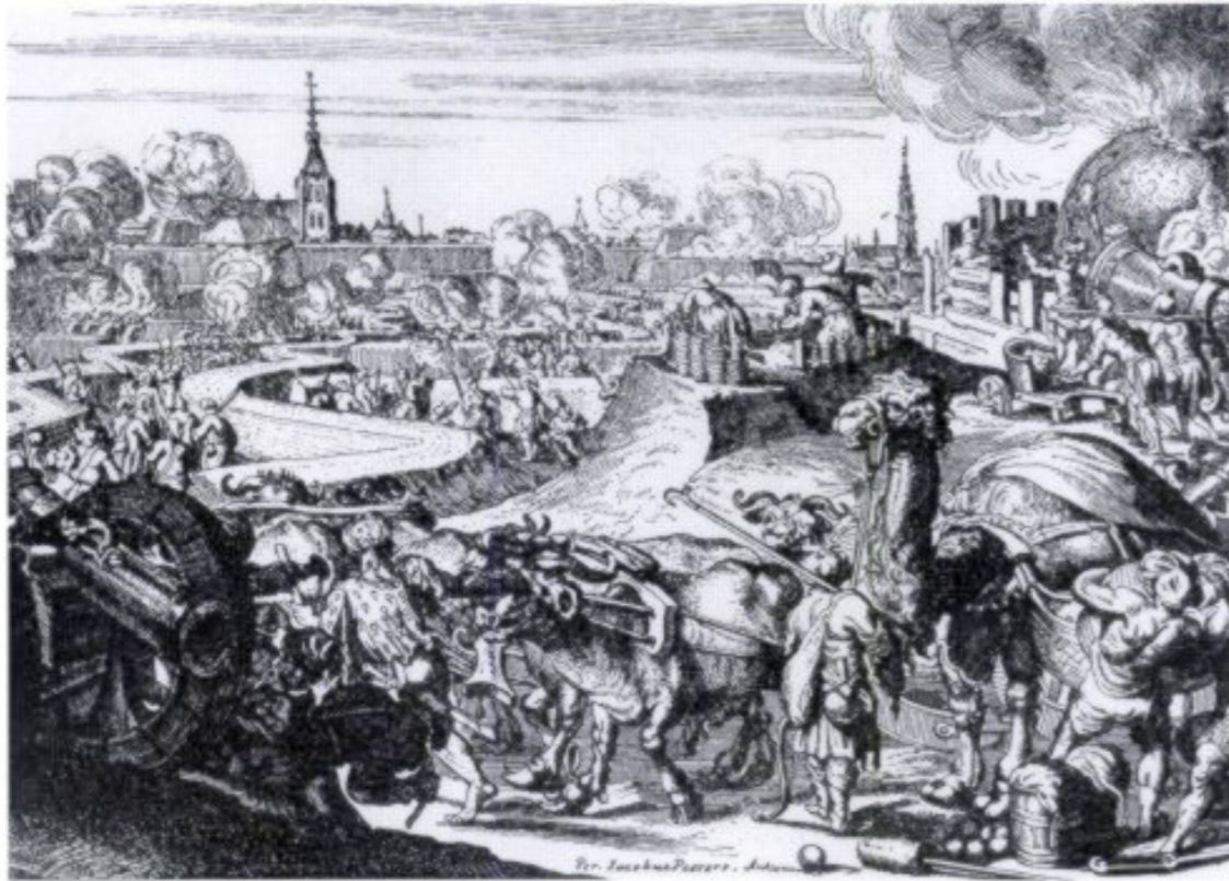
Die Türken unter Kara Mustafa belagern Wien – eine Radierung von Jacobus Peeters nach Romeyn de Hooghe (1683).

Kurz nach 1700 hat er sich von Johann Lukas von Hildebrandt in Ráckeve nahe Budapest ein Schloss errichten lassen. Zehn Jahre später beauftragt er Hildebrandt, ihm am Fuß ausgedehnter Acker- und Weingärtengründe zwischen dem heutigen Rennweg und Gürtel einen Gartenpalast zu bauen, eine Art suburbane Villa samt französischem Park mit Bassins, Orangerie und einer Menagerie mit exotischen Tieren. 1721 beschließt er, diesem Unteren Belvedere am Scheitel des Abhanges einen zweiten Palastbau gegenüberzustellen. Dieses Obere Belvedere , das repräsentativen Zwecken dienen soll, gerät noch weit prächtiger und gilt mit seiner durch Pavillonblöcke und Zeltdächer gegliederten Fassade und den verschwenderisch dekorierten Räumlichkeiten bis heute als Ikone der profanen Prunkarchitektur jener Aufbruchzeit.