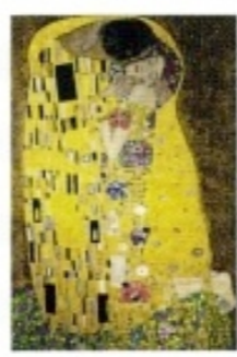
1908 Gustav Klimts »Der Kuss« ist eines der bedeutendsten Gemälde des Jugendstils.