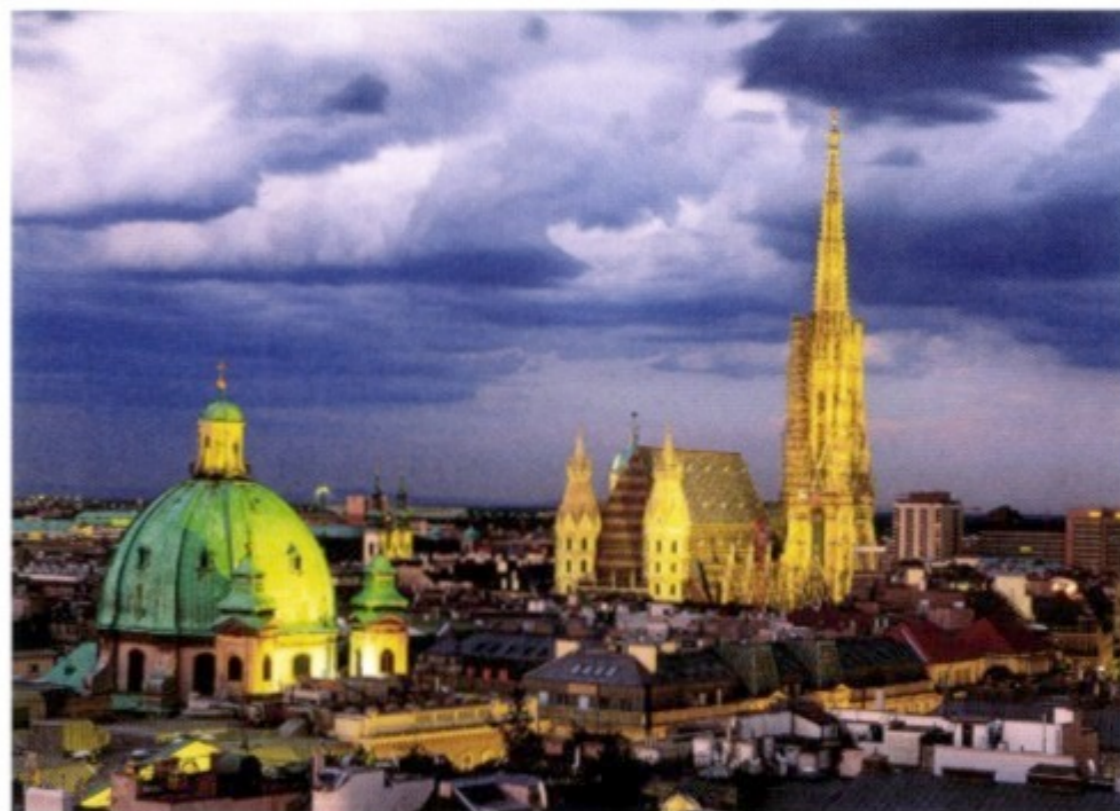
In der Kreuzkapelle des Stephansdoms (rechts) fand Prinz Eugen seine letzte Ruhestätte.

Auf dem politisch-diplomatischen Parkett beginnt Prinz Eugen um 1700 im Zuge des Spanischen Erbfolgekriegs eine wichtige Rolle zu spielen. Um dem Bündnis Frankreichs mit Bayern und den aufständischen Ungarn entgegenzuwirken, schmiedet er mit den Niederlanden und Briten die Haager Koalition. Höchstädt, Turin, Oudenaarde, Lille und Malplaquet markieren wichtige Siege, die aber das langwierige Ringen noch nicht beenden. Erst die