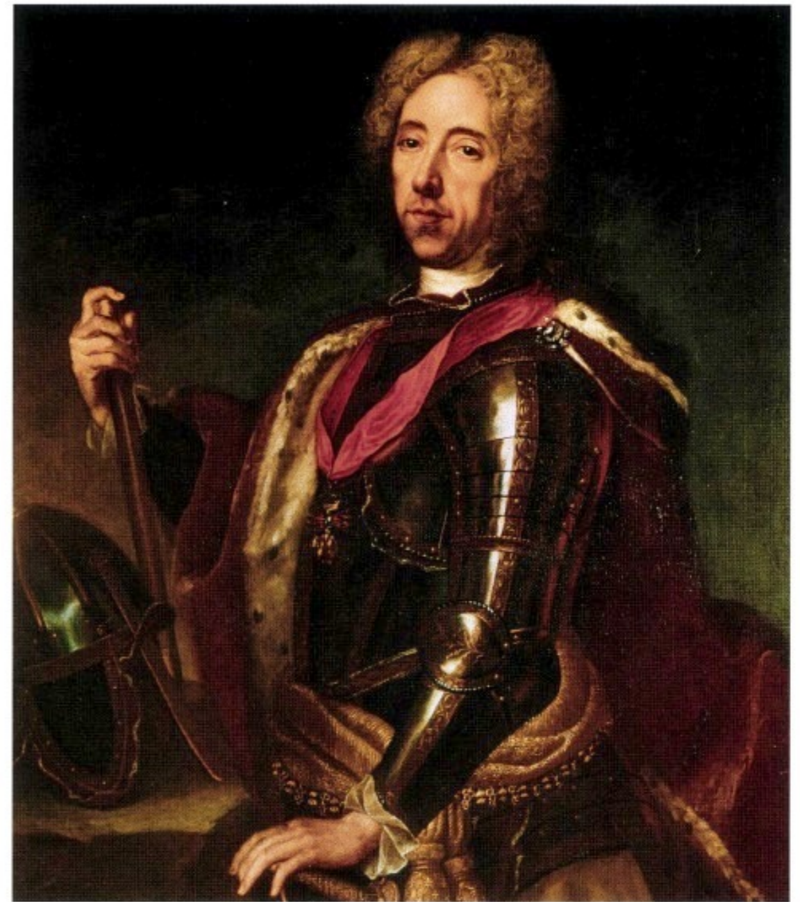
Prinz Eugen von Savoyen, Österreichs großer Feldherr und Staatsmann, hier auf einem Gemälde von Johann Kupetzky (um 1710).

Der zweite Grund für das Belvedere: Kein anderes Bauwerk führt Macht und Geschmack Prinz Eugens so eindrücklich vor Augen. Gewiss, auch das Winterpalais, das er sich 1697 von Johann Bernhard Fischer von Erlach in der Himmelfortgasse hat bauen