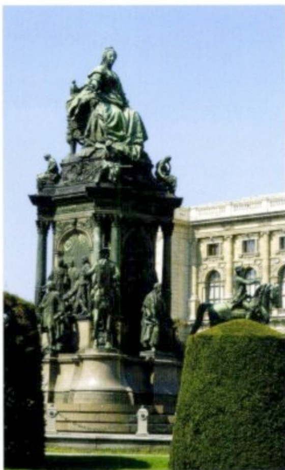
Das Maria-Theresia-Denkmal am Maria-Theresien-Platz jenseits des Burgrings.

historischem Museum (► B 5) errichtet hat, ihre Stellung und Selbstsicht: Als sechs Meter hohe Bronzestatue weist sie auf die zu ihren Füßen um sich gescharte Riege der Generale, Staatsmänner und Gelehrten – »Magna Mater Austriae«, Ihre Majestät die Landesmutter, als Inkarnation absolutistischer Macht (► B 5).