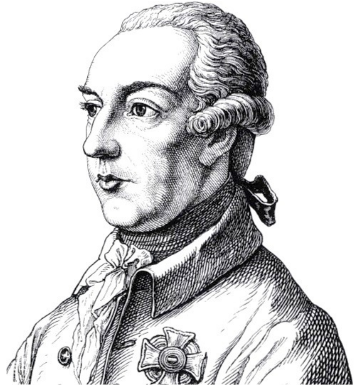
Joseph II. auf einem zeitgenössischen Stich. Der Aufklärer auf dem Kaiserthron widmete sein Leben dem Glück seiner Untertanen.

Was Joseph II. und Maria Theresia , seit 1745 de facto römisch-deutsche Kaiserin, eint, ist ihre Zugehörigkeit zum Haus Habsburg. Was die beiden trennt, sind ihr Amtsverständnis und die gesellschaftspolitische Grundhaltung. Die Monarchin sieht sich von Gottes Gnaden in ihr Amt eingesetzt. Sie hat zwar die Verwaltung modernisiert, die allgemeine Schulpflicht eingeführt, den Frondienst gemildert und die Folter abgeschafft. In ihrer Ära sind