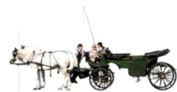
1693–heute Von der ersten Lizenz bis heute prägen die Fiaker das Stadtbild.