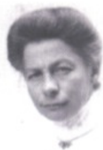
Ivana Kobilca – Sloweniens namhafteste Malerin, berühmt u. a. für ihre folkloristischen Genrebilder.