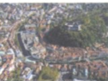
Sloweniens Hauptstadt aus der Vogelperspektive: Die Parallelen zu Salzburg sind nicht zu leugnen.

Slowenien ist mit gut 20000 km 2 kaum größer als Niederösterreich. Es beherbergt knapp zwei Millionen Menschen. Sein Bruttoinlandsprodukt beträgt rund 25 Mrd. Euro – etwa die Hälfte des Vermögens von Bill Gates. Doch so niedlich die nördlichste der ehemaligen jugoslawischen Teilrepubliken wirken mag, so facettenreich sind ihre Landschaft, Geschichte und touristischen Reize. Und so ehrgeizig und erfolgreich sucht und findet sie gegenwärtig Anschluss an den Westen. Slowenien trat bereits im Laufe der Beitrittsverhandlungen als ein Musterschüler in Erscheinung. Wirtschaft und Lebensstandard nähern sich rasant dem Niveau der „alten“ EU-Länder. Die überwiegend katholischen Slowenen gelten als Schweizer unter den Slawen – als weltoffen, blitzsauber und diszipliniert; grundsolide mit einem Schuss Schick wie die Kühlschränke und Herde von Gorenje, einem ihrer Vorzeigekonzerne. Dazu kommt ein Touch südländisches Temperament, der so erfrischend perlig schmeckt wie Radenska-Mineralwasser, ein anderer Exportschlager des kleinen Staates.