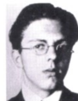
Srečko Kosovel – frühreifer, allzu jung verstorbener Meister existenzialistischer Dichtkunst.

Jože Plečnik (* 1872 in Ljubljana, † 1957 ebenda). Architekt. Wenige Städte sind so von einer einzigen Hand geprägt wie Ljubljana von diesem genialen Einzelgänger. Als Sohn eines Tischlermeisters lernte er in frühen Jahren, dass der Perfektionsanspruch auch für das kleinste Detail zu gelten hat. An der Ljubljanica geboren, verwandelte er seine baulich bis dahin eher provinzielle Heimatstadt in nur dreieinhalb Jahrzehnten in die stolze, weil moderne Metropole der Slowenischen Nation. Er studierte in Graz an der Kunstakademie, ging dann nach Wien und entwickelte dort als der talentierteste Student Otto Wagners seine eigene Stilsprache, indem er stark reduzierte manieristische und klassische Elemente, etwa Säulen, Obelisken und Pyramiden, nicht mehr nur nach funktionellen, sondern auch idealistischen Kriterien einsetzte. Von 1911–1921 lebte er in Prag, wo er unterrichtete und maßgeblich an der Renovierung des Hradschin beteiligt war. Unter seinen zahllosen Werken ragen in Ljubljana die National- und Universitätsbibliothek, die berühmten Drei Brücken, das Flussufer samt Markthalle, der Friedhof Zale und draußen in Crna vas die Michaelskirche hervor. Er war sowohl Stadtplaner als auch De-