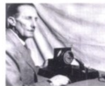
Anton Codelli – Pionier des Funkwesens und der kabellosen Bildübertragung, sprich Fernseh-technik.