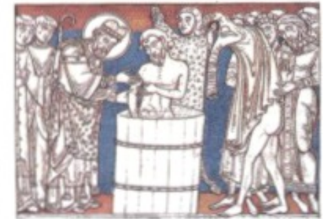
Der hl. Rupert (gest. 718), erster Bischof von Salzburg und „Apostel von Kärnten“, tauft slawische „Heiden“. Als Subtext in der Miniatur aus dem 12. Jh. enthalten ist die mit diesem Übertritt verbundene Etablierung deutscher Feudalstrukturen.

976 Karantanien wird von Bayern separiert und zum Großherzogtum erhoben. Die Marken Steiermark, Kärnten, Krain, Triest, Görz und Istrien entstehen. Aus dieser Zeit stammen auch die ältesten erhaltenen slowenischen Texte, die Freisinger Sprachdenkmäler. Die von Adel und Klerus geförderte deutsche Kolonisation führt zu einer steten, bis in das 15. Jh. andauernden Schrumpfung des slowenischen Siedlungsgebiets.