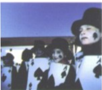
Wenn die Stadt zur Bühne wird: Auftritt beim Straßentheater-Festival „Ana Desetnica“ Ende Juni.