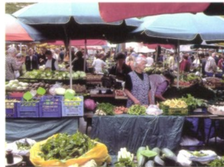
Ein Bummel über Ljubljanas Obst- und Gemüsemarkt wird zu einer Wallfahrt der Sinne.