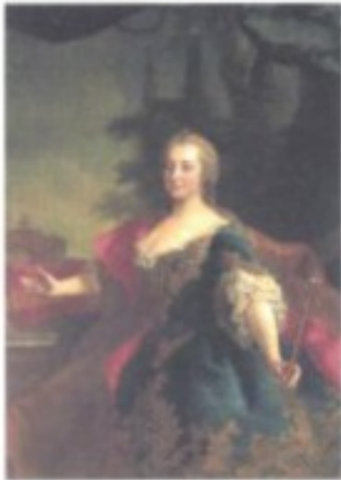
Die von Kaiserin Maria Theresia im gesamten Habsburgerreich initiierten Reformen bescherten auch Slowenien merkliche soziale und ökonomische Fortschritte.

systems „verstummt“ das slowenische Schrifttum erneut. Ein wirtschaftlicher und gesellschaftlicher Aufschwung setzt erst wieder unter der Herrschaft Maria Theresias (1740–1780) ein. Sie etabliert neue Verwaltungsstrukturen, schafft die Zölle zwischen den Provinzen des Reiches ab, lässt neue Straßen anlegen und führt mit Deutsch als Unterrichtssprache die allgemeine Schulpflicht ein. Ihr Sohn Joseph II. (1780–1790) setzt die Reformen fort und gestattet zumindest in den Volksschulen auch den Gebrauch des Slowenischen.