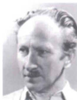
Edvard Kocbek – der „slowenische Camus“, der ein Leben lang gegen Verlogenheit und Machtmissbrauch anscrieb.