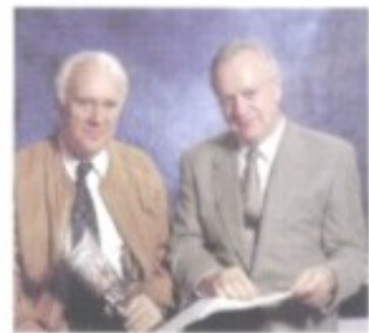
Die Brüder Slavko und Vilko Avsenik – Begründer der Original-Oberkrainer und Polka-Könige der Welt.

Slavko Avsenik (* 1929 in Begunje). Musiker. Als Autodidakt auf dem Akkordeon kreierte er in den 1960er Jahren einen speziellen Sound, der vor allem dank seiner eigenwilligen Sechzehntel-Begleitung auf der Harmonika zum unverwechselbaren Markenzeichen dieses Musik-Genres und unzähliger Epigonen wurde. Den Grundstein für seinen beispiellosen Erfolg als „Polka-König der Welt“ legte Avsenik schon als junger Bursch im familieneigenen Gasthaus gemeinsam mit seinem Bruder Vilko, der damals noch die Klarinette spielte. Nach einiger Zeit des Spiels im Duo überdrüssig, schmiedete er ein aus Akkordeon, Klarinette, Trompete, Gitarre und Bariton-Horn bestehendes Ensemble, während sich sein Bruder Vilko ganz dem Arrangieren verschrieb. Dies war die Geburtsstunde des „Original Oberkrainer-Sounds“ und gleichzeitig der Beginn einer Weltkarriere. In ihren volkstümlichen Liedern, die man rund um den Erdball kennt, besingen die Avseniks die Schönheiten ihrer Heimat und die Lebensart ihrer Landsleute. Dafür erhielten sie über 30 goldene Schallplatten. Von ihren 120 Tonträgern verkauften die Oberkrainer, die nicht zuletzt dank dutzender Fernsehauftritte einem Massenpublikum bekannt wurden, mehr als 31 Millionen Exemplare.