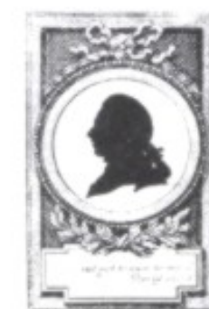
Anton Tomaž Linhart – Schöpfer viel gespielter Komödien mit aufklärerisch-humanistischem Gedankengut.