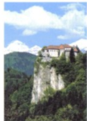
140 m über dem See von Bled thronte schon vor 1000 Jahren eine kühne Burg.

Was sich in und um Bled sonst noch unternehmen lässt? Vielerlei! Unbedingt sollte man einmal zu Fuß den See umrunden und am Ende im Parkhotel die legendären Cremeschnitten verkosten. Zum Standardprogramm zählt auch die Überfahrt zur Insel an Bord einer Pletna, eines Mitteldings aus hölzerner Gondel und Platte. Zu Füßen der Burg lädt