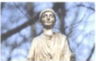
Eines der berühmtesten Fundstücke aus römischen Zeiten in Ljubljana: die Statue des „Bürgers von Emona“

Über die ersten Menschen im Gebiet des heutigen Slowenien ist nicht viel bekannt. Funde wie die Steinwerkzeuge aus der Loza-Höhle bei Orehek, beweisen aber die frühe Anwesenheit unserer Vorfahren vor rund 250.000 Jahren. Wichtiger noch ist die Entdeckung des wohl ältesten Musikinstruments der Menschheit, einer 35.000 Jahre alten Flöte aus Knochen. Wichtig auch in Hinblick auf die Tatsache, dass der Fundort, die Höhle Divje Babe im Idrijca-Tal, zu dieser Zeit von Neandertalern besiedelt wurde, denen die Wissenschaft bis vor kurzem keinerlei Kulturfähigkeit zugestand.