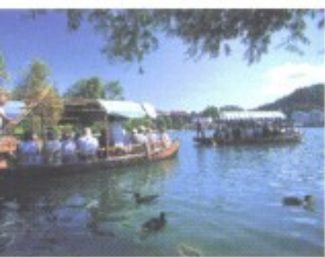
Halb Gondel, halb Platte: Wer nicht hinüber schwimmt, setzt in der Regel an Bord einer solchen „Pletna“ zur Insel über.

Die Insel (Otok) inmitten des 2 km langen Sees war vermutlich schon in heidnischer Zeit Kultstätte. Die Existenz einer christlichen Kirche ist für das 9. Jh. belegt. Sie wurde – auch für Gläubige aus Kärnten, der Steiermark und Friaul – bald zum Pilgerort. Der heutige Barockbau „Zu Unserer lieben Frau“ mit seiner gotischen Madonna, dem opulenten Hochaltar und der 99-stufigen Treppe vor dem Portal gilt in diesem Teil Sloweniens als die Hochzeitskirche schlechthin. Seit der Schweizer Arzt Arnold Rikli Mitte des 19. Jh. am östlichen Seeufer ein Badehaus samt Gästehütten baute, um fortan eine Therapie aus Sonnen-, Luft- und Wasserbädern anzubieten, wurde Bled auch zum weltlichen Pilgerort. Als es dann um die Jahrhundertwende bei einer Kurorte-Ausstellung in Wien eine Goldmedaille einheimste, avancierte es gar zu einem der In-Treffs der k.u.k.-Hautevolee. Ein Ruf, der dem schicken Ort auch nach 1918 zugute kam, als