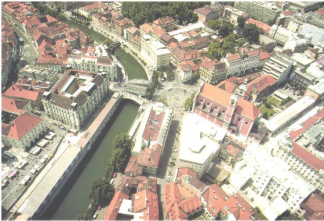
Ein Blick aufs Herz der Stadtlandschaft: Die menschengerechten Proportionen sind auch aus dieser Perspektive zu erkennen.

barocker Altstadtfassade noch Mittelalter und Gotik entdecken kann, so liegen unter der heutigen Heiterkeit sehr wohl auch düstere Kapitel der Geschichte verborgen. Während des Zweiten Weltkriegs etwa verwandelten die Italiener die Stadt in ein riesiges, mit Stacheldraht umzäuntes Gefängnis. Zweimal, 1511 und 1895, zerstörten Erdbeben große Teile der Bausubstanz. Die letzte heftige Erschütterung brachte Ende Juni 1991 der Unabhängigkeitskrieg gegen die jugoslawischen Streitkräfte, der zum Glück nur zehn Tage dauerte.