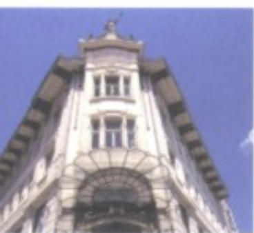
Das Kaufhaus Urbanc alias Centromercur mit seinem Portal im Stil des Pariser Art nouveau.

Überquert man die Ljubljana und hält sich noch vor dem Informationsbüro des städtischen Tourismusamtes links, steht man vor einem nächsten plečnikschen Hauptwerk: Die das Flussufer säumenden Markthallen [3] schuf der Meister in den Jahren 1940–1944. Die Kolonnaden mit ihren fein säuberlich abgeteilten, aber doch einheitlich gestalteten Obst- und Gemüseständen auf Straßenniveau und dem licht-