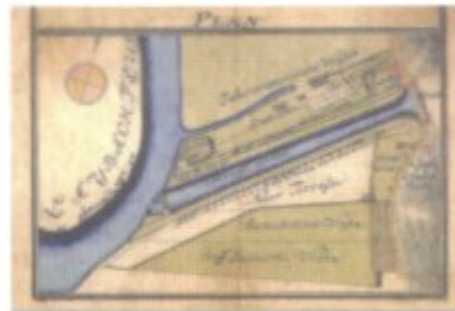
Um das Laibacher Moor trockenulegen, wurden Ende des 18. Jh. nach Plänen des Jesuiten Gabriel Gruber Kanäle gegraben.