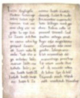
Die im 10. Jh. entstandenen Freisinger Sprachdenkmäler stellen die ersten erhaltenen slowenischen Texte in lateinischer Schrift und das erste schriftliche Zeugnis lebender slowenischer Sprache dar.

11./12./13 Jh. Im Zuge der Christianisierung kommt es zur Gründung und Förderung von Klöstern, etwa in Ossiach (1028), Gurk (1043), Gornji Grad (1140) und Stična (1136). Sie werden zu wichtigen Zentren der Kultur, in denen die Schriftkultur im Allgemeinen und die slowenische Sprache im Speziellen gepflegt werden – ein wesentlicher Faktor für das Fortbestehen der Volkssprache. Im selben Zeitraum erhalten auch zahlreiche Siedlungen, Friesach zum Beispiel (1130), Kamnik (1228), Kranj (1256), Ljubljana (1243), Ptuj (1250), Maribor (1254) und Piran (1274), das Stadtrecht und werden zu Brennpunkten von Handel und Gewerbe. Darüber hinaus entstehen wichtige frühindustrielle Zentren, Kropa zum Beispiel als Brennpunkt der Eisenverarbeitung oder Idrija mit seinen Quecksilberminen.