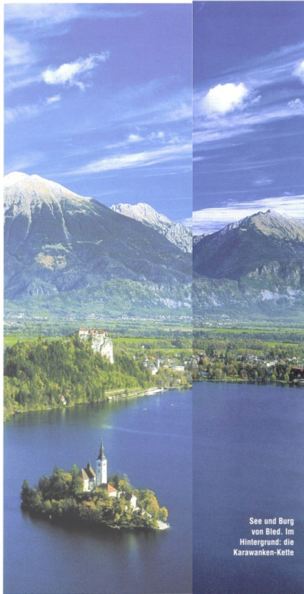
See und Burg von Bled. Im Hintergrund: die Karawanken-Kette

Bled bis Bled: ca. 370 km, empfohlen: mindestens 4 Tage