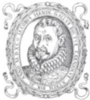
Jacobus Gallus – ein typischer Meister der Gegenreformation, berühmt für seine Motetten mit für die damalige Zeit oft kühner Chromatik.

fessur für Kunstgeschichte innehatte, am Wiederaufbau des Isonzo-Tales. In dem Karstdorf Stanjel schuf er den „Ferrari-Park“ und bekleidete bis 1945 das Amt des Bürgermeisters. Zu den wegweisenden Einzelbauten des Urbanisten zählen: in Ljubljana die Häuser Krisper, Bamberg, Hribar und in Wien das Artariahaus und die Urania.