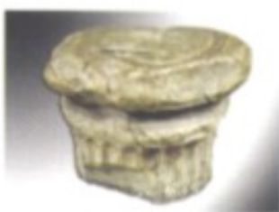
Der berühmte Fürstenstein von Karnburg im kärntnerischen Zollfeld. Auf ihm fand seit der Ära des Fürstentums Karantanien bis ins frühe 15. Jh. ein bäuerlich-demokratisches Ritual zur Inthronisation des neuen Herrschers statt.