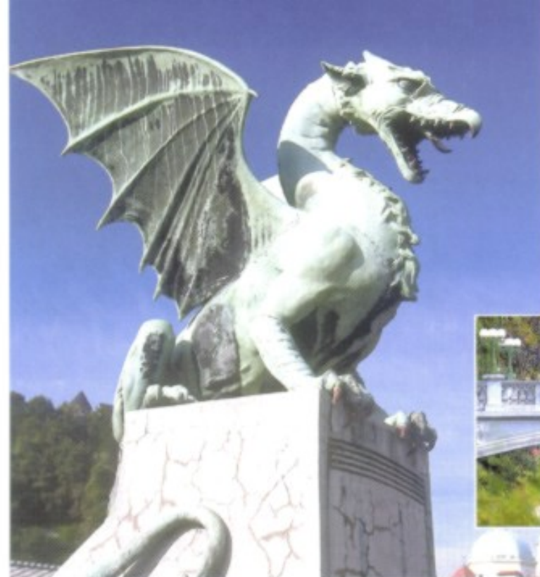
Ljubljanas Wappentier, der Drache, bewacht in vierfacher Ausführung die formschöne Jugendstilbrücke.