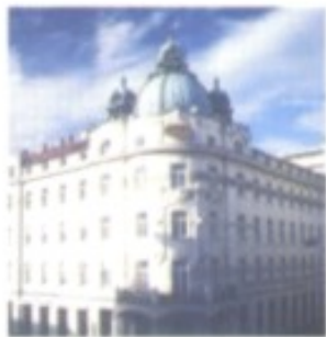
Blick über die Dächer der kleinen Großstadt zur Burg; darunter: das elegante Hotel Union

Die von Jože Plečnik entworfene Michaelskirche in Črna Vas, der ältesten Siedlung auf dem Gebiet des Laibacher Moores.