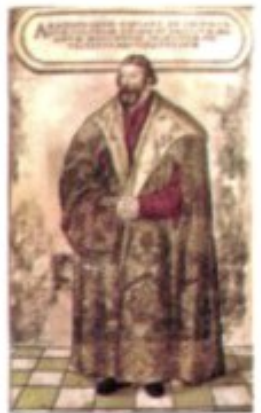
Siegmund Herberstein – Diplomat, Humanist und als Schriftsteller Chronist des russischen Alltagslebens im 16. Jh.

Anton Janša (* 1734 in Breznica, † 1773 in Wien). Bienenzüchter, Künstler. Seiner in Wien genossenen Ausbildung nach war er Akademischer Maler, doch schon 1769 wurde er von Maria Theresia zum ersten kaiserlichen Imkereilehrer ernannt. Damals galt Slowenien europaweit als Zentrum moderner Bienenhaltung. Der Honig der grauen Krainer Biene, aber auch Wachs und Waben wurden in alle Welt exportiert. Janša züchtete im kaiserlichen Augarten in Wien Bienen und unterrichtete. Seine Lehren basierten auf der jahrhundertealten Praxis seiner Landsleute und sind bis heute aktuell. Er verfasste eine Abhandlung über das Schwärmen der Bienen und ein umfangreiches Grundsatzwerk über die Imkerei, für das er selbst etliche Abbildungen zeichnete. Seine künstlerischen Fähigkeiten nützte er auch, um zahlreiche Bienenstockbretter (s. S. 64 Radovljica ) zu bemalen. Ein wesentliches Verdienst Janšas besteht darin, die Imkerei zu einem wirtschaftlichen Faktor gemacht zu haben.