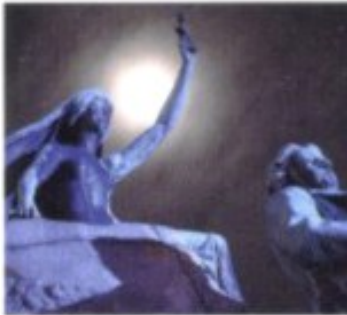
In der (vor-)revolutionären Zeit bis 1848 avancierte France Prešeren, der die slowenische Schriftsprache vereinheitlichte, zum Nationalhelden, der er bis heute ist. Im Bild: sein Denkmal am Prešernov trg.

Ab 1867 Die Niederlage der Habsburgermonarchie im preußisch-österreichischen Krieg von 1866, der Verlust Venetiens und das Ausscheiden aus dem Deutschen Bund verschärfen die politischen Gegensätze innerhalb des Kaiserreichs. Die Regierung Kaiser Franz Josephs sieht sich genötigt, Reformen einzuleiten. 1867 kommt es zwar zum Ausgleich mit Ungarn, zur Enttäuschung vor allem der Tschechen und Slowenen jedoch nicht zu einem mit den Slawen. Stattdessen erlässt man für die österreichische Reichshälfte eine neue Verfassung. Wahlen werden ausgeschrieben. Von allgemeinen Wahlen kann freilich noch keine Rede sein, vielmehr wird das Stimmrecht nach Kurien und Zensus vergeben, was die wohlhabende städtische und deutsche Bevölkerung bevorzugt. Dennoch erringen die Slowenen im Landtag von Krain die Mehrheit. Zwischen 1868 und 1871 finden nach tschechischem Vorbild in allen slowenischen Gebieten so genannte Tabors, Massenversammlungen unter freiem Himmel, statt. Diese Zusammenkünfte mit bis zu 30.000 Teilnehmern wirken für die weitere Entwicklung des slowenischen Selbstwert- und Nationalgefühls als Katalysatoren. Als Triebfeder erweist sich entgegen ihrer Absicht auch die Politik der deutschliberalen Regierung in Wien, indem sie Druck ausübt, um die slowenische Mehrheit im Krainer Landtag zugunsten der deutschsprachigen 6,5-prozentigen