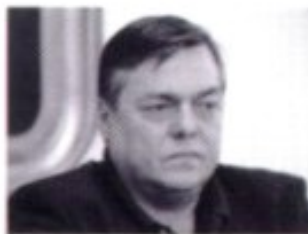
Drago Jančar – der Schriftsteller ist berühmt für seine literarischen Qualitäten und für sein politisches Engagement.