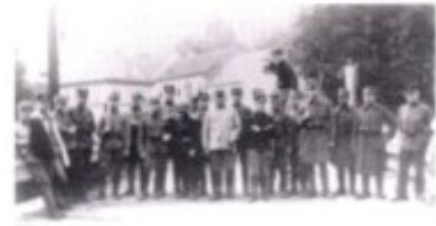
Österreichische Soldaten und solche des neuen Staates der Serben, Kroaten und Slowenen (SHS) auf der Brücke von Radkersburg. Die Anfang 1919 umkämpfte Stadt blieb letztlich bei Österreich.

1920–1940 Der neue Staat der Serben, Kroaten und Slowenen erweist sich bald als ebenso zentralistisches Gebilde, wie es zuvor die Habsburgermonarchie war. Freilich haben die Slowenen dank ihrem relativ kompakten Siedlungsgebiet und dem eigenständigen Wesen ihrer Sprache weniger Konflikte mit der Zentralmacht in Belgrad auszutragen als die Kroaten. Auch kulturell und wirtschaftlich genießen sie einen vergleichsweise hohen Grad an Autonomie, der sich in der rasanten Weiterentwicklung Ljubljanas als Kultur- und Wirtschafts-