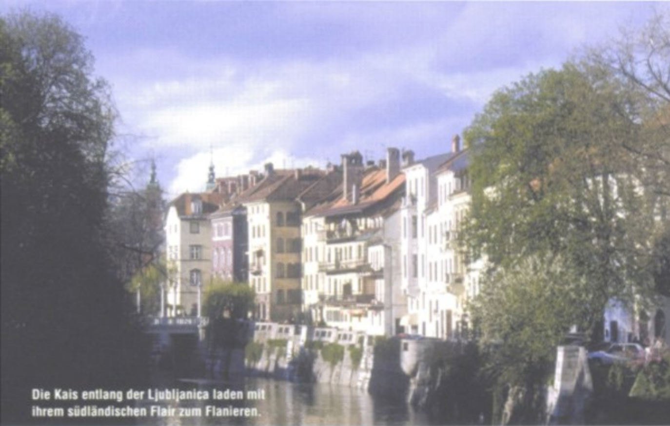
Die Kais entlang der Ljubljanica laden mit ihrem südländischen Flair zum Flanieren.