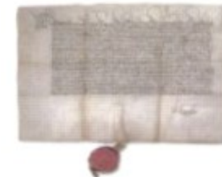
Ein Beispiel für den direkten Einfluss der Habsburger auf slowenische Belange: ein Dokument aus dem Jahr 1535, mit dem Kaiser Ferdinand I. einen Handelskonflikt in der Region beilegte.

17./18. Jh. Vom Dreißigjährigen Krieg, der vor allem in Deutschland und Böhmen tobt, bleiben die slowenischen Gebiete verschont. Nach seinem Ende und der Festigung des absolutistischen Herrschafts-