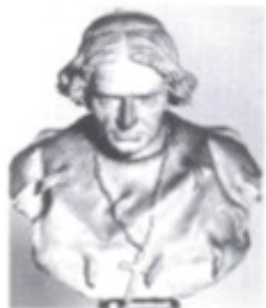
Friderik Baraga – Priester und Missionar, der die Sprachen der Indianer erforschte.

Slavko Avsenik (* 1929 in Begunje). Musiker. Als Autodidakt auf dem Akkordeon kreierte er in den 1960er Jahren einen speziellen Sound, der vor allem dank seiner eigenwilligen Sechzehntel-Begleitung auf der Harmonika zum unverwechselbaren Markenzeichen dieses Musik-Genres und unzähliger Epigonen wurde. Den Grundstein für seinen beispiellosen Erfolg als „Polka-König der Welt“ legte Avsenik schon als junger Bursch im familieneigenen Gasthaus gemeinsam mit seinem Bruder Vilko, der damals noch die Klarinette spielte. Nach einiger Zeit des Spiels im Duo überdrüssig, schmiedete er ein aus Akkordeon, Klarinette, Trompete, Gitarre und Bariton-Horn bestehendes Ensemble, während sich sein Bruder Vilko ganz dem Arrangieren verschrieb. Dies war die Geburtsstunde des „Original Oberkrainer-Sounds“ und gleichzeitig der Beginn einer Weltkarriere. In ihren volkstümlichen Liedern, die man rund um den Erdball kennt, besingen die Avseniks die Schönheiten ihrer Heimat und die Lebensart ihrer Landsleute. Dafür erhielten sie über 30 goldene Schallplatten. Von ihren 120 Tonträgern verkauften die Oberkrainer, die nicht zuletzt dank dutzender Fernsehauftritte einem Massenpublikum bekannt wurden, mehr als 31 Millionen Exemplare.