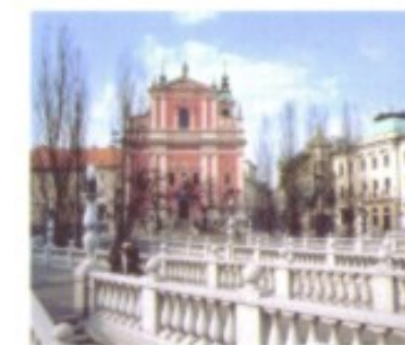
Das Scharnier zwischen Alt- und Neustadt: die Drei Brücken, im Hintergrund die Franziskanerkirche

Weshalb also bei so viel Esprit und Jugendlichkeit Paolo Coelho, der Bestsellerautor, seine kummervolle Romanheldin Veronika, „die zu sterben beschloss“, ausgerechnet aus Ljubljana stammen ließ? Ein Rätsel. Das einzig Triste an dieser so sympathischen Stadt scheinen die Trauerweiden zu sein, die ihre Äste entlang den Ufern der Ljubljanica reihenweise im smaragdgrünen Fluss zu ertränken suchen. Obwohl – so wie man bei genauem Hinsehen hinter manch