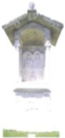
Die Nekropole von Sempeter bei Celje zählt zu den schönsten Hinterlassenschaften der Römer auf slowenischem Boden.