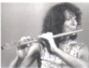
Irena Grafenauer – eine der weltweit führenden Flötistinnen mit Lehrstuhl am Mozarteum Salzburg.