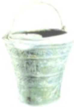
Die berühmte Situla von Vace: ein besonders schönes Exemplar einer Bronzetreibarbeit aus der Zeit um 600 v. Chr.