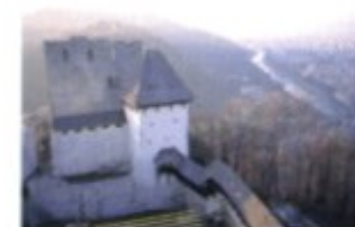
Von der ersten Hälfte des 14. Jh. an bildete die Burg von Celje das Machtzentrum eines überaus ehrgeizigen Adelsgeschlechts. Die Grafen von Cilli wurden sogar in den Reichsfürstenstand erhoben und damit zu ernst zu nehmenden Gegenspielern der Habsburger. 1456 starben sie im männlichen Stamm aus.