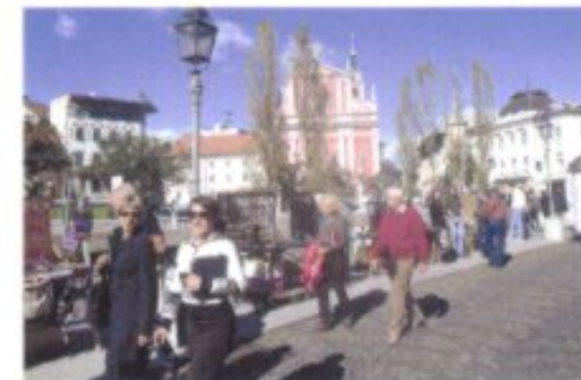
Ein Paradies für Fußgänger mit Sinn für das Schöne: die Flanierwege beiderseits der Ljubljanica.

Eine von Plečniks berühmtesten Schöpfungen, die Drei Brücken (Tromostovje) [1], bildet denn auch den logischen Ausgangspunkt für den Spaziergang durch die Innenstadt. Bereits 1842 hatte man an diesem verkehrsstrategisch wichtigen Zugang über die Ljubljanica in die Altstadt anstelle einer hölzernen Brücke eine aus Stein geschlagen (und sie, wie heute noch eine Inschrift kundtut, dem Vater des späteren Kaisers Franz Joseph gewidmet). 1931 fügte Plečnik, als er im Zuge der neuen Ufergestaltung die zum Fluss hinabführenden Gerbertreppen anlegte, dieser Haupt- zwei Nebenbrücken für Fußgänger an. Sie helfen seither, einem Trichter gleich, den Verkehr Richtung Burgberg zu bündeln. Der Platz nördlich der Tripelbrücke trägt den Namen France Prešeren's (s. S. 25, Personengalerie ). Folgerichtig wacht der unsterbliche Nationaldichter, in Bronze gegossen und mit Lorbeer bekränzt, über das emsige Alltags-treiben. Den Sockel des kurz nach 1900 errichteten Denkmals hat Max Fabiani, den figürlichen Teil Ivan Zajec entworfen. Wer Prešeren's melancholischem Blick folgt, kann, Adлераugen vorausgesetzt, schräg gegenüber auf der Fassade des Hauses Wolfova ulica Nr. 4, eine kleine Gestalt aus Terrakotta ausmachen. Es handelt sich