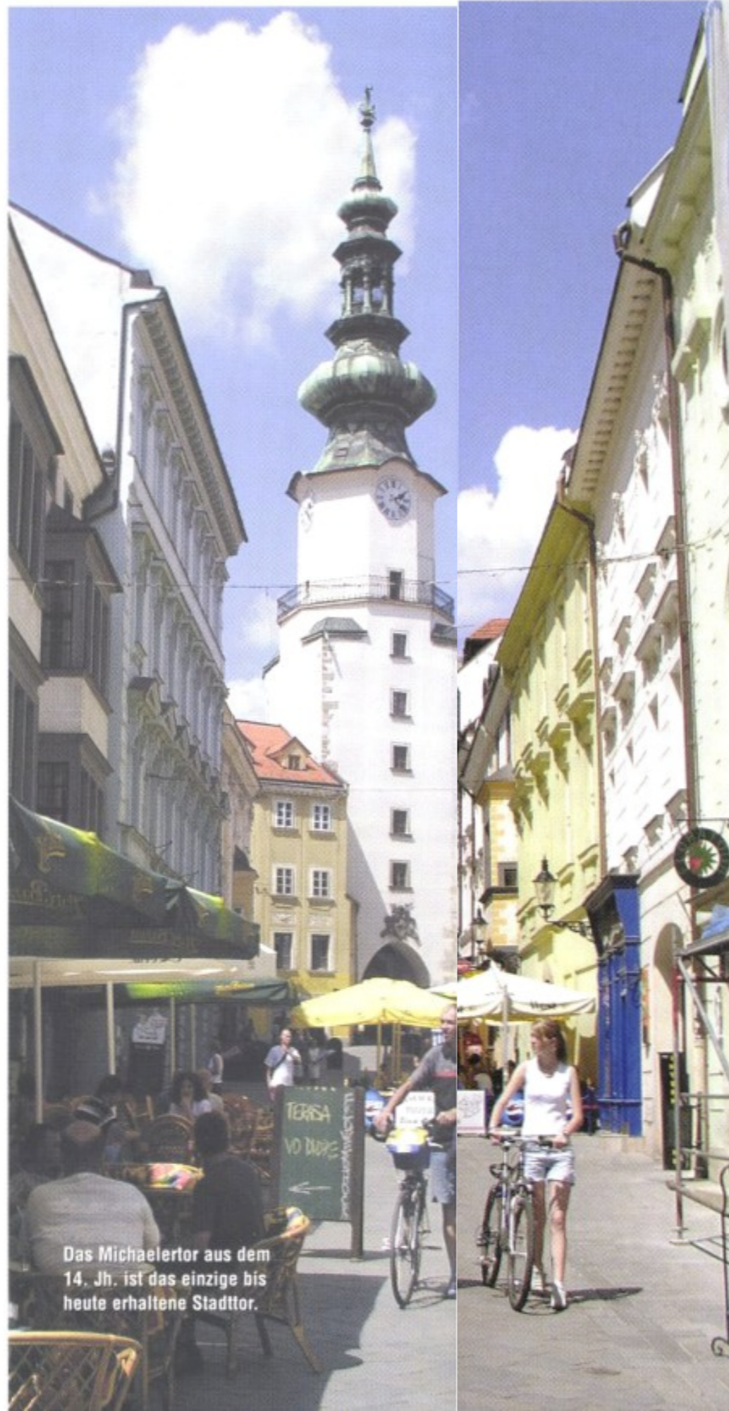
Das Michaelertor aus dem 14. Jh. ist das einzige bis heute erhaltene Stadttor.

Bratislava – Kleine Karpaten – Lednické Rovne und zurück – ca. 500 km, empfohlen: mindestens 3 Tage