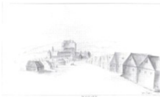
Eine alte Ansicht von Bojnice: Bis in dieses Städtchen am Oberlauf der Nitra nahe dem heutigen Städtchen Prievidza drangen die türkischen Verbände 1530 vor.