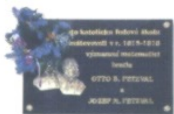
Gedenktafel für den begnadeten Musiker und Mechaniker Jozef Maximilián Petzval, der als Begründer der modernen Fotografie in die Geschichte einging.

Jozef Petzval war ein geschickter Schleifer und Feinmechaniker, aber ein schwieriger Mensch. Er hatte das von ihm entwickelte Porträtoobjektiv dem Wiener Unternehmer Peter Wilhelm Friedrich von Voigtländer ohne Patentierung und Vertrag gegen eine lächerliche geringe, einmalige Zahlung von 2000 Gulden überlassen, was in einen dauerhaften Streit zwischen den beiden mündete. Daraufhin verschob Voigtländer seine Produktion nach Deutschland und schickte sich an, von dort mittels Massenproduktion den Markt zu beherrschen. Sein Wiener Gegenüber schrieb sich indes als einer der Begründer der geometrischen Optik, der modernen Fotografie und Kinematografie, als Erfinder des Opernglases und Entdecker des modernen anastigmatischen Linsensystems in die Annalen ein. Heute werden eine optische Porträtlinse und ein Mondkrater nach ihm benannt. Und das österreichische Unterrichtsministerium verleiht seit 1928 alljährlich die Petzval-Medaille für besondere Leistungen auf dem Gebiet der wissenschaftlichen Fotografie.