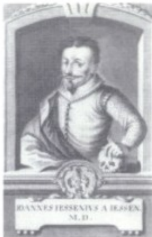
Janko Jesenský seziierte als erster Anatom öffentlich einen Leichnam und wurde später Rektor der Prager Karlsuniversität.

Janko Jesenský (Jessenius) (*1566 Breslau-Vel'ký Jasen, †1621 Prag) Arzt, Anatom, Chirurg, Philosoph, Humanist. Er ergriff nach dem Studium der Medizin in Wittenberg, Leipzig und Padua 1593 in Breslau den Beruf des praktischen Arztes. Ein Jahr später war er Professor für Anatomie und Chirurgie in Wittenberg. Im Jahr 1600 seziierte er vor seinen Studenten öffentlich, damals eine Pioniertat, den Leichnam eines Hingerichteten. Im Jahr darauf hielt er die Grabrede für seinen verstorbenen Freund Tycho de Brahe. Als überaus erfolgreicher Mediziner wurde er Leibarzt der sächsischen Kurfürsten, ab 1602 von Kaiser Rudolf II. und später von dessen Bruder Matthias. 1617 zum Rektor der Karlsuniversität in Prag gewählt, geriet er zu Beginn des Dreißigjährigen Krieges wegen seines Glaubens in Konflikt mit dem Kaiser und wurde in Prag öffentlich hingerichtet.