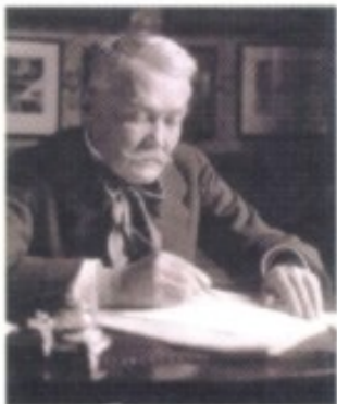
Pavol Országh Hviezdoslav machte sich durch Übersetzung von Weltliteratur ins Slowakische und Schöpfer des Versromans „Des Hegers Weib“ unsterblich.

Meister Paul von Leutschau (*1470?, †1535 Leutschau/Levoča) Holzbildhauer. Über die Herkunft und das frühe Leben dieses spätgotischen Schnitzers ist wenig bekannt. Er folgte höchstwahrscheinlich um 1506 einer Einladung in die damals sehr reiche Stadt Leutschau und gründete hier seine eigene Schnitzerwerkstatt. Von 1508 bis 1517 schuf er für die Leutschauer Jakobskirche den Hauptaltar, den mit 18,6 m Höhe größten Holzaltar der Welt. In derselben Kirche wie auch in zahlreichen Kirchen der Region Zips (s. Route 4, S. 110 ff.) stehen etliche weitere von ihm beziehungsweise seinen Mitarbeitern meis-