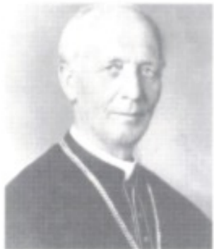
Andrej Hlinka, von Beruf katholischer Priester, kämpfte als überzeugter Gegner der „Magyarisierung“, gestützt auf die Slowakische Volkspartei, für die Autonomie seiner Heimat.

auch ein eigenständiges Banken- und Betriebswesen entwickelt. Die Industrien in Böhmen und Mähren zählen zu den leistungsfähigsten Europas, das Land zu jenen mit der modernsten Infrastruktur. Die Slowakei hingegen (auf deren Gebiet nach Ende des Krieges noch Kämpfe gegen ungarische Honvedtruppen und gegen die ungarische „Rote Armee“ ausgefochten werden) ist landwirtschaftlich geprägt, slowakische Banken oder Industriebetriebe gibt es kaum, von einem in der Selbstverwaltung erfahrenen Berufsbeamten ganz zu schweigen. Dass nun vor allem tschechische Beamte in der Slowakei tätig werden und man einige Betriebe und Banken durchaus absichtsvoll in den Ruin treibt, sorgt unter den Slowaken für Verstimmung. Dass zudem die Staatsideologie des „Tschechoslowakismus“ vorherrscht, empfinden sie als Bedrohung ihrer Autonomiebestrebungen. Auch die katholische Kirche, die in der Slowakei ungleich stärker als in Böhmen und Mähren ist, sieht in der laizistisch ausgerichteten Prager Regierung einen Gegner. Dennoch sind es die Jahre der Ersten Republik, in denen die Slowaken erstmals die volle Entfaltung ihrer nationalen Selbstbehauptung erleben. Die „Matica slovenská“ wird wieder eingerichtet, an den Schulen wird in slowakischer Sprache unterrichtet. In dem Ausmaß, in dem das nationale Selbstbewusstsein gestärkt wird, nehmen die Differenzen mit Prag zu.