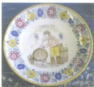
Die Wirtschaft der Slowakei war, wie dieser Keramikteiler illustriert, zu Zeiten der Österreich-Ungarischen Monarchie, ja bis weit ins 20. Jahrhundert hinein, vorwiegend agrarisch geprägt.