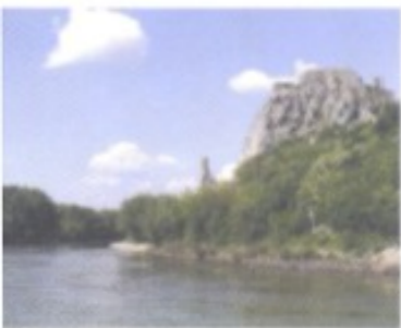
Die Burg Devín an der österreichisch-slowakischen Grenze: Von diesem seinem Sitz an der Donau herrschte Fürst Mojmir über das von ihm geeinte Großmährische Reich.

Mojmir I. (*?, †846) Fürst. Über die Herrschaft dieses christlichen Slawenfürsten ist sehr wenig bekannt. Mojmir, der vermutlich auf der Burg von Devín wohnte und über das Gebiet des heutigen Mähren herrschte, vertrieb 833 seinen Nachbarn und Rivalen, den mährischen Anführer Pribina, aus Neutra und vereinigte beide Fürstentümer. So entstand das Großmährische Reich, das unter diesem Namen zum ersten Mal vom byzantinischen Kaiser Konstantin VII. um 950 erwähnt wurde. Das Fürstentum von Neutra wurde zu einem Lehnfürstentum, in dem sich die Thronanwärter des herrschenden Mojmiriden-Geschlechts als Fürsten gleichsam ihre Sporen verdienten.