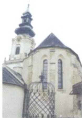
Der Schlossbrunnen in der Festung zu Nitra. Auf dem an drei Seiten von der Nitra umflossenen Hügel hatten möglicherweise schon die Quaden im 4. Jh. ein Kastell. Fest steht, dass hier im Jahr 828 die erste Kirche auf dem Boden der heutigen Slowakei stand.

11.–15. Jh. Die ersten 300 Jahre magyarischer Herrschaft erweisen sich für die Slowaken als ein Zeitalter relativen Friedens, ökonomischen Aufschwungs sowie kultureller Eigenständigkeit. Vor allem die reichen Vorkommen an Gold, Silber und Kupfer tragen erheblich zur Gründung neuer Städte bei. Gegen Ende des 15. Jh. kontrollieren die Fugger aus Augsburg gemeinsam mit der Thurzo-Familie den Kupferbergbau und sichern ihren Arbeitern einen Acht-Stunden-Tag,