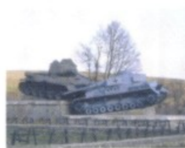
Nahe der Stadtgrenze von Svidník, an der Straße Richtung Dukla-Pass, erinnern zwei ineinander verkeilte Panzer an die opferreichen Schlachten, die Sowjets und Deutsche gegen Ende des Zweiten Weltkriegs in dieser Gegend fochten.