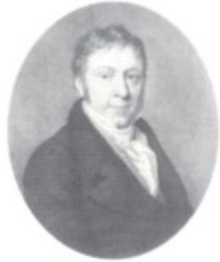
Johann Nepomuk Hummel, ein Schüler Mozarts, war ab 1804 Nachfolger Joseph Haydns als Kapellmeister des Fürsten Esterházy.

Andrej Hlinka (*1864 Černová bei Ružomberok, †1938 ebenda) Theologe, Politiker. Wurde nach seinem Studium am Priester-Seminar in Černová als 25-Jähriger ordiniert und gründete als überzeugter Gegner der „Magyarisierung“ der Slowaken ein Protestblatt, die Volkszeitung „L'udove Noviny“. Später übernahm er die Führung der extrem nationalistischen „Slowakischen Volkspartei“ (L'udová strana oder HSL'S). Auf Grund seiner politischen Tätigkeit wurde er 1906 suspendiert und drei Jahre durch ungarische Behörden gefangengehalten – eine Zeit, die er zur Übersetzung des Alten Testaments ins Slowakische nutzte und die ihn zu einer Art nationalem Märtyrer machte. Im Krieg diente er beim Roten Kreuz. Der Politiker Hlinka leistete im Verbund mit den Tschechen Bedeutendes für die Errichtung der Tschechoslowakei, befand sich aber bald in Opposition zur Politik der Prager Regierung und zeitweilig auch zur Kirche. Sein Ziel war die Autonomie der Slowakei. Seine später in „Hlinkas Slowakische Volkspartei“ umgetaufte Bewegung wurde mehr und mehr zu einem Sammelbecken konservativ-klerikaler wie auch rechtsradikal-nationalistischer Kreise (Näheres: s. Geschichte, S. 12).