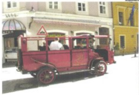
Ein Bummel durch die Altstadt von Bratislava hält an allen Ecken Überraschungen bereit: etwa in Form von Oldtimern, die zur Rundfahrt laden, oder in der Statue eines stadtbekanntes Flaneurs, dem „schönen Náci“.