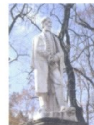
Der Philologe und Schriftsteller Ludovít Štúr verströmte, wie auf dem Podest in Stein verewigt, auch zu Lebzeiten große Autorität. 1848 wurde er zum Führer des slowakischen Aufstandes.