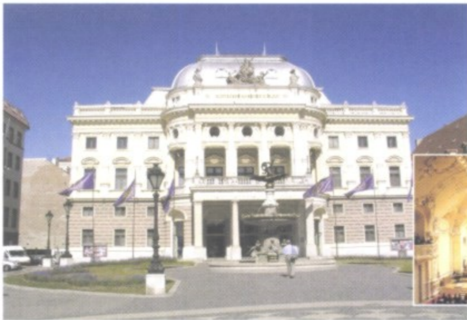
Das im Stil der Neo-Renaissance gestaltete Nationaltheater (im Bild: innen und außen) wird vor allem für Opern und Ballett genutzt.