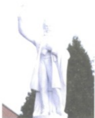
Ludovít Štúr – im Bild: das Denkmal in der Stadt Modra, wo er hauptsächlich lebte und wirkte – war im 19. Jh. der prominenteste Kämpfer für die nationale Selbstständigkeit der Slowakei.