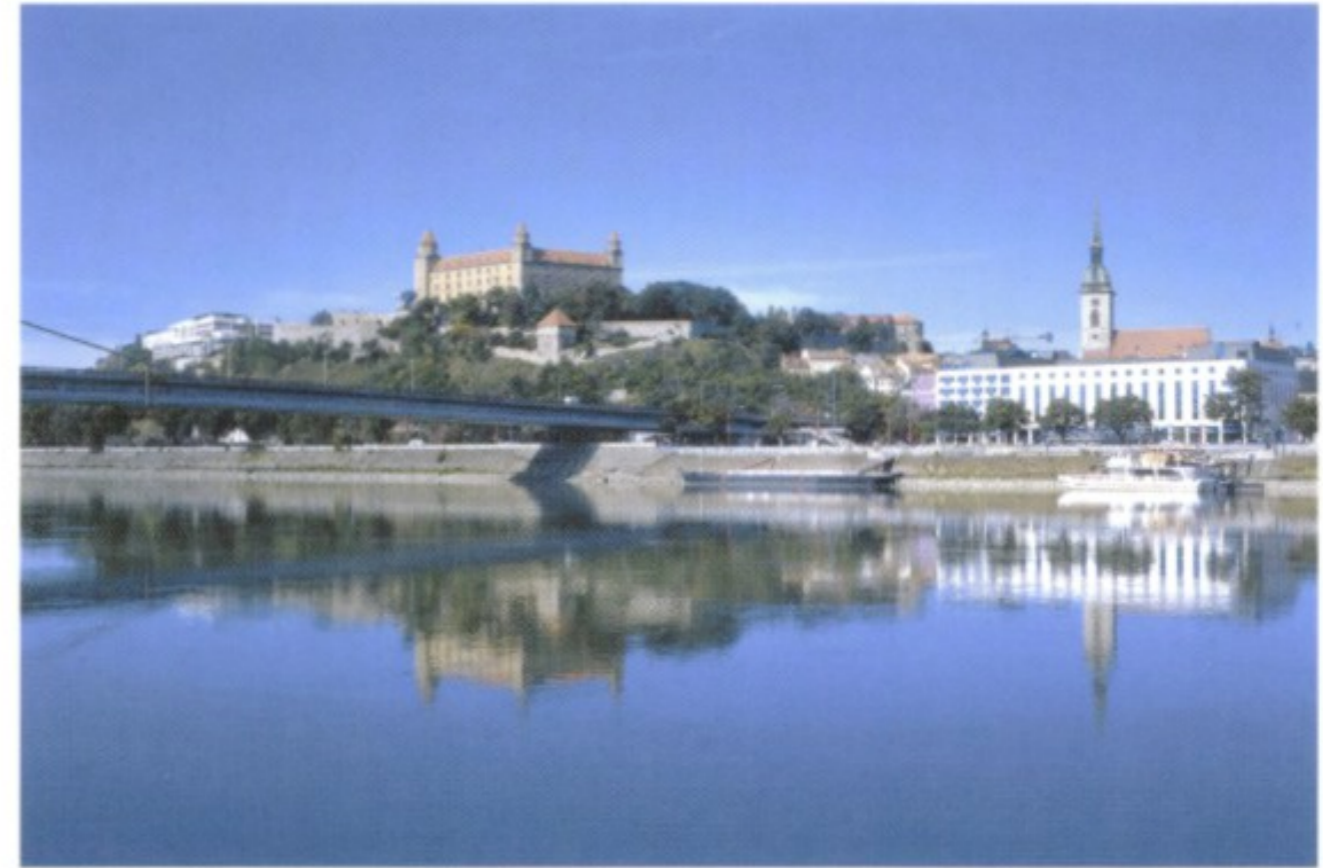
Profanes und Sakrales an den Gestaden der Donau: die „Neue Brücke“ und, direkt am Fluss, das Hotel Danube. Dahinter: der Turm des Martinsdomes und links oben die Burg.

Bei so viel Glanz und Reichtum war es selbstverständlich, dass in Pressburg auch bedeutende Künstler tätig waren. Die herausragendsten waren der Bildhauer Raphael Donner und