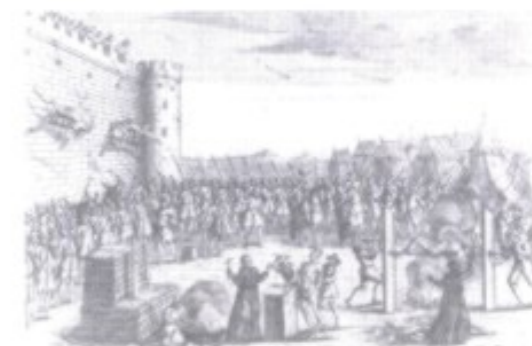
Eine im ausgehenden 17. Jh. im östlichen Teil des Habsburgerreiches nicht seltene Szene: Aufständische Ungarn werden von kaiserlichen Truppen hingerichtet.

1781–1848 Das Toleranzpatent Kaiser Josephs II. garantiert freie Religionsausübung in allen Ländern der Monarchie. Das eröffnet den Protestanten in der Slowakei neue Entfaltungsmöglichkeiten. Während die evangelische Kirchenliteratur vorerst noch in Tschechisch geschrieben wird, entdeckt ein katholischer Geistlicher die Eigenstän-