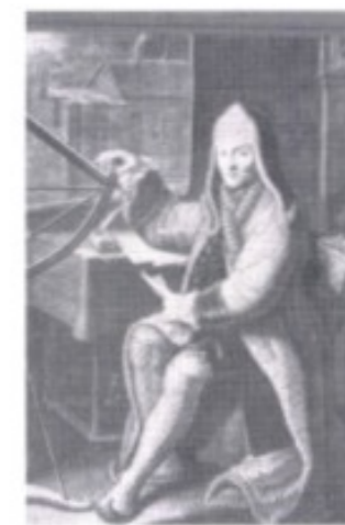
Maximilian Hell: Jesuitisch erzogen und anfangs als Priester tätig, machte er das Firmament zu seiner Leidenschaft.