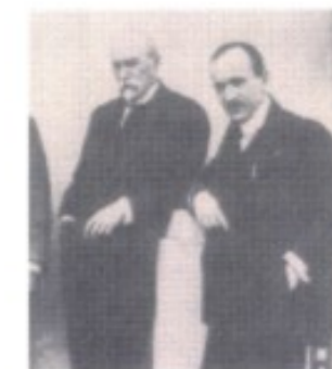
Tomáš Garrigue Masaryk (links) und Edvard Beneš (rechts) gründeten 1918 gemeinsam einen tschechoslowakischen Nationalrat. Die Verschmelzung von Tschechen und Slowaken in einem Staat wurde 1918 im „Vertrag von Pittsburgh“ besiegelt.