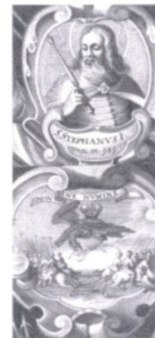
Nachdem der Hl. Stephan (im Bild als Schutzpatron einer neuzeitlichen Schlacht) im Jahr 1000 einen ersten ungarischen Zentralstaat geschaffen hatte, war das Gebiet der späteren Slowakei als „Oberungarn“ ein Teil des magyarischen Reiches.