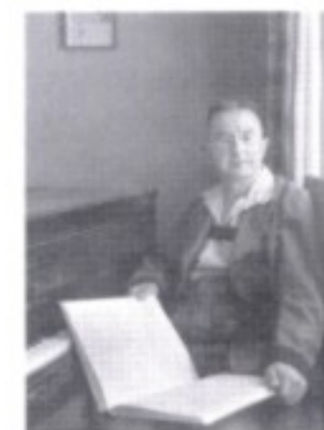
Der Komponist Franz Schmidt, der an der Wiener Musikhochschule lehrte. Zu seinen Hauptwerken zählen das Oratorium „Das Buch mit den sieben Siegeln“ und die Oper „Notre Dame“.

Franz Schmidt (*1874 Bratislava, †1939 Wien) Komponist. Schon mit 14 nach Wien gekommen, studierte Schmidt am Konservatorium Komposition, Klavier und Cello. Bis 1914 war er, eine Zeitlang unter Gustav Mahler, als Cellist an der Wiener Hofoper tätig, ehe er für elf Jahre an der Hochschule für Musik Klavier unterrichtete. 1925 wurde er deren Direktor, danach Rektor. Schmidt komponierte vier Symphonien, mehrere Klavierwerke, zwei Klarinettenquintette und zwei Opern: „Notre Dame“ und „Fredigundis“. Sein heute wohl bekanntestes Werk ist das Oratorium „Das Buch mit den sieben Siegeln“ (1935–37). Obwohl sein Kompositionsstil als konservativ gilt, gehört er, ohne selbst Modernist gewesen zu sein, eigentlich zur Moderne. Er kombinierte die klassische Musiktradition seiner Vorgänger mit sehr persönlichen, innovativen Harmonien und Orchestrierungen. Seine Werke sind für Traditionalisten zu kompliziert (und auch ob ihrer technischen Herausforderungen „berüchtigt“), für die Avantgarde jedoch zu traditio-