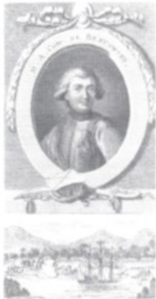
Schillernder als das von Moritz Benyovsky (siehe gegenüberliegende Seite) kann das Leben eines einzelnen Menschen wohl schwerlich verlaufen. Offizier, Seemann, Entdecker und König von Madagaskar – was für eine Biografie!

Michael Johann Joseph Brokoff (*1686 Klášterec nad Ohří, *1721 Prag) Bildhauer. In der Werkstatt des Vaters Jan (s.o.) lernte Michael die Kunst des Schnitzens. Nach dessen Tod übernahm er den Betrieb