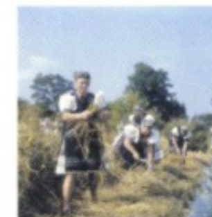
Volkstümliche Szene wie diese Bäuerinnen in Tracht bei der Ernte waren einst integraler Bestandteil des slowakischen Selbstverständnisses.

1919–1939 Die Erwartungen an den neuen gemeinsamen Staat sind hoch gesteckt, die Voraussetzungen in den beiden Landesteilen hingegen höchst unterschiedlich. In Böhmen und Mähren, die zu Österreich gehörten, hat sich ein tschechisches Berufsbeamtentum und