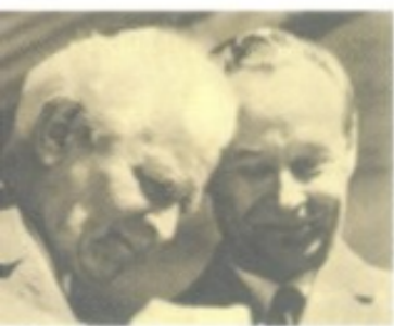
Symbolfigur für einen „Sozialismus mit menschlichem Antlitz“: Alexander Dubček war Repräsentant der Reformer des Prager Frühlings (im Bild mit General Ludvík Svoboda).

Martina Hingis (*1980 Košice) Tennisspielerin. Mit zwei hielt sie das erste Mal ein Racket in Händen, mit nur drei schlug sie bereits konsequent den Tennisball über das Netz, und mit zarten vier bestritt Klein-Martina ihr erstes Turnier. Im Herbst 1994, mit vierzehn, stieg das „Wunderkind“ in den Profizirkus ein. Beim ihrem ersten GP-Turnier erreichte sie auf Anhieb das Viertelfinale. Zwei Jahre später feierte sie bereits Finalsiege in Serie. 1997, mit nur siebzehn, war sie die Nummer eins. Doch musste sie nach mehreren schweren Verletzungen, Operationen und viel Leid die Profi-Karriere frühzeitig an den Nagel hängen. Seither lebt sie in der Schweiz und arbeitet rund um den Globus als Sportreporterin und Tennis-Coach.