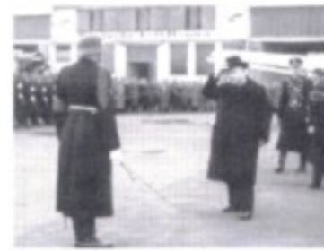
Der studierte Theologe Jozef Tiso nimmt als Präsident des deutschen Schutzstaates Slowakei nach seiner Ankunft in Berlin-Tempelhof die Meldung des Offiziers der Leibstandarte Adolf Hitler entgegen.

Der neue, faschistisch ausgerichtete slowakische Staat wird sogleich unter den „Schutz“ des Deutschen Reichs gestellt. Tiso wird Staats-, Tuka Ministerpräsident. Gleichsam als Lohn erhält die Slowakei im Herbst 1939 kleinere Gebietsstreifen Polens zugesprochen.