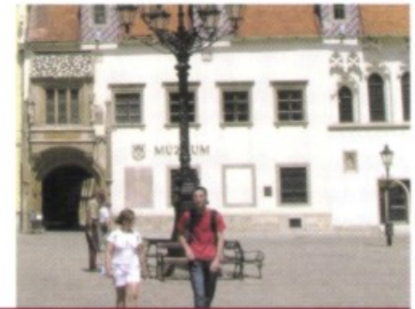
Das Alte Rathaus: In seinen Kellergewölben ist das Mittelaltermuseum, eine schaurige Schau über die einstigen Methoden der Justiz, untergebracht.

Ausflugstipp Ruine Devín: Die Burgruine Devín (zu Deutsch Theben) verspricht ein unvergessliches Erlebnis. Sie erhebt sich auf einem 212 m hohen Felsen über dem Zusammenfluss von March und Donau. Das strategisch wahrscheinlich noch bedeutendere Massiv als der Burgberg von Bratislava dürfte schon in der Frühzeit besiedelt gewesen sein. Für die Römer war es eine wichtige, befestigte Grenzstation, und die Grundmauern einer Kapelle aus dem 5. Jh. dürften die ältesten christlichen Spuren der Slowakei sein. Heute sehen die Slowaken in den altslawischen Ruinenresten die Wurzeln ihrer Identität. Der romantischste Teil der Ruinen auf dem unter Naturschutz gestellten Burghügel ist der isoliert auf einem steil zur Donau abfallenden Felsen stehende Jungfernturm, von dem sich der Sage nach einst ein unglückliches Liebespaar in die Tiefe gestürzt haben soll.