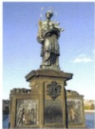
Eines der Meisterwerke des Bildhauers Jan Brokoff: das Modell für den Hl. Nepomuk auf der Karlsbrücke in Prag.