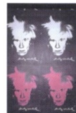
Andy Warhol, der Vater der Pop Art, wurde zwar in Pittsburgh/USA geboren. Doch seine Familie stammt aus der nordöstlichsten Ostslowakei.

Andy Warhol (*1928 Pittsburgh, †1987 New York) Künstler, Schriftsteller, Filmemacher. Seine Eltern stammten aus dem Dorf Mikova bei Medzilaborce im äußersten Nordosten der heutigen Slowakei. Dort, wo seine familiären Wurzeln liegen, steht heute ein seinem Leben und Wirken gewidmetes Museum für moderne Kunst. Als Andy Warhola in Pittsburgh zur Welt gekommen, studierte er dort an der Carnegie-Fachhochschule grafische Kunst. 1949 ging er nach New York und arbeitete als Grafiker und Illustrator für namhafte Zeitschriften wie Vogue, The New Yorker, Seventeen und Harper's Bazaar. In den frühen 50er Jahren begann er, in New Yorker Galerien private Zeichnungen auszustellen. Bereits 1961 war er ein Weltstar der Bildenden Kunst. Ein Jahr später entstanden die ersten Siebdrucke von Dollarbanknoten sowie die unsterblichen Serigrafien der Campbell-Dosen. Zur selben Zeit begann Warhol Prominente vom Rang einer Liz Taylor oder eines Elvis Presley zu porträtieren. Zum Kultwerk wurde das berühmte Porträt von Marilyn Monroe. Während seine Bilder die Welt beherrschten, wandte er sich anderen Genres – Film, Theater und Musik – zu. Die Warhol-Factory produzierte seit 1963 in Kollektivarbeit legendäre Experimentalfilme wie „Sleep“, „Empire“ u.v.m. Als Hauptvertreter der Pop Art veränderte Warhol das Kunstverständnis einer ganzen Epoche.