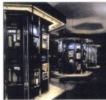
Das Palais Herzer birgt eine riesige und sehr reizvoll gestaltete Insektensammlung.

Ein Rundgang durch den weitgehend Fußgängern vorbehaltenen historischen Kern offenbart dementsprechend einen reichen Schatz an barocken Baudenkmalern. Beginnt man ihn im Südosten, dort, wo in den 1870er Jahren das Wiener Architektenduo Helmer und Fellner, wie in so vielen Provinzstädten der k.u.k.-Monarchie, einen Theaterbau im Stil der Neorenaissance hinterließ, stößt man zunächst auf die St.-Nikolaus-Kirche . Der dem Schutzheiligen der Stadt geweihte Bau besitzt, ein Hinweis auf seinen gotischen Kern, einen für diese Region ungewöhnlichen Wehrturm. Noch viel erstaunlicher ist, womit eine Ecke weiter das frühklassizistische Palais Herczer aufwartet: nämlich einem faszinierenden Museum über die Welt der Insekten . Wie bauen Wespen ihre Nester, kommunizieren Ameisen, orientieren sich Nachtfalter? Rund 45.000 überaus sorgsam arrangierte Exponate beantworten – nach der Wiedereröffnung im Dezember 2005 mit modernster Didaktik – alle nur erdenklichen einschlägigen Fragen. Gleich