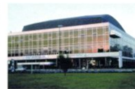
Wie sehr die Kroaten die romantischen Kompositionen ihres Landsmannes Vatroslav Lisinski bis heute schätzen, belegt die Tatsache, dass sie das neue Konzerthaus in der Hauptstadt nach ihm benannten.

Andrija Kačić-Miošić (* 1704 Brist nahe Makarska, † 1760 Zaostrog) Priester, Dichter, Professor. Erzogen im Stift Zaostrog und ausgebildet in Osijek, Budim und Venedig, lehrte der hochgebildete Franziskanermönch zunächst in Zaostrog und Šibenik Philosophie und Theologie. In späteren Jahren wirkte er als Abt auf der Insel Brač. Sein dichterisches Hauptwerk, eine Sammlung epischer Schriften mit dem launigen Titel „Das angenehme Gespräch des slawischen Volkes“, ist