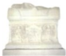
Ebenfalls in Split ausgestellt: ein römischer Sarkophag mit überaus kunstvollen Reliefs.

Bereits im Paläolithikum , um 100.000 v. Chr., besiedeln Menschen den Raum des heutigen Kroatien. Siedlungen konnten unter anderem in der Nähe von Krapina, Veternica, Vindija und Šandalja nachgewiesen werden. Jungsteinzeitliche Siedlungstätigkeit zwischen 6000 und 2000 v. Chr. ist für Danilo bei Šibenik und auf der Insel Hvar gesichert.