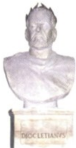
Der römische Kaiser Diokletian hinterließ den Kroaten eine architektonische Sensation von Welt-rang: seinen zu beträchtlichen Teilen bis heute erhaltenen Palast in Split.

Juraj Dalmatinac (* um 1420, † 1473 Zadar) Bildhauer und Architekt. Nach seiner Ausbildung in Venedig schuf dieser wohl bekannteste kroatische Künstler aus der Übergangszeit von der Spätgotik zur Renaissance ein überaus umfangreiches Werk. Seine Plastiken und Skulpturen, Kirchen, Wohnhäuser und Befestigungsanlagen sind in ganz Dalmatien, aber etwa auch in Ancona oder in Venedig, wo er Gildeschulen einrichtete, zu finden. Zu seinen Hauptwerken zählen der urbanistische Plan für die Stadt Pag und die Kathedrale von Šibenik, wo er auch die Bauhütte leitete. Außerdem ging er als Erfinder der „Fertigbauweise“ mit Steinplatten in die Kunstgeschichte ein.