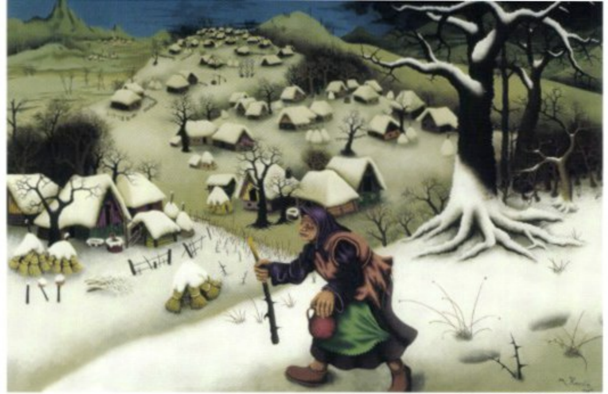
Musterbeispiel für den speziellen Stil der Künstler aus Hlebine: „Frau in Winterlandschaft“ von Mijo Kovačić, Öl auf Glas, 1965.