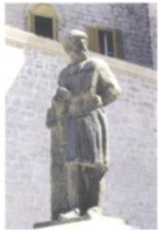
Dalmatiens großer Bildhauer des 15. Jh. Juraj Dalmatinac blickt, von Ivan Meštrović in Stein gemeißelt, von seinem Podest auf das Hauptportal der Kathedrale von Šibenik.