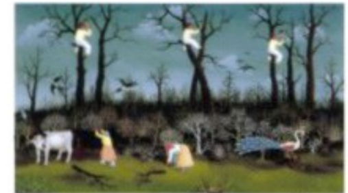
„Holzfäller“ (1959, Öl auf Glas) von Ivan Generalić, ein für den Mitbegründer der „Schule von Hlebine“ charakteristisches Werk, ist im Zagreber Museum der Naiven Malerei zu bewundern.