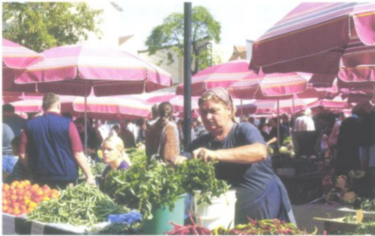
Der Dolac, unweit der Kathedrale gelegen, gilt dank seines riesigen Angebots an täglich frisch aus dem Umland angelieferten Lebensmitteln als der „Bauch der Hauptstadt“.