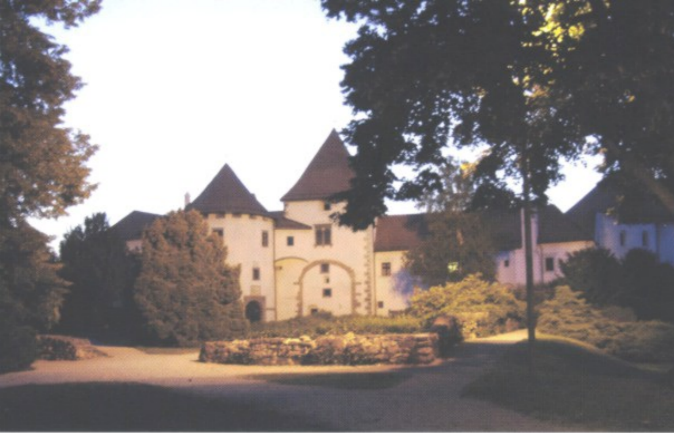
Stari Grad, die alte Burg von Varaždin, beherbergt heute das Stadtmuseum.