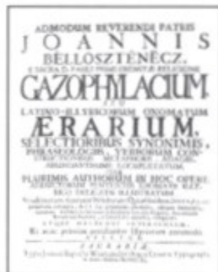
„Gazophylacium“, ein Wörterbuch der kroatischen Mundarten, ist das Hauptwerk des im 17. Jh. tätigen Philologen Ivan Belostenec. Im Bild: das Titelblatt einer frühen Ausgabe.

Ivan Belostenec (* 1594 Varaždin, † 1675 Lepoglava). Mönch, Philologe. Als Angehöriger des Ordens der Pauliner lehrte er an deren berühmtem Gymnasium in Lepoglava und machte sich um dessen wirtschaftliche und kulturelle Entwicklung sehr verdient. Sein Lebenswerk ist das große enzyklopädische Wörterbuch der drei Mundarten der kroatischen Sprache, das so genannte „Gazophylacium“. Dieses monumentale Werk umfasst auf 2000 Seiten mehr als 40.000 lateinische Wörter und ihre jeweilige Übersetzung. Es ist nicht nur für Kroatien, sondern für die europäische Kulturgeschichte insgesamt von großer Bedeutung. Ursprünglich sollte das Werk unter den Titel „Dictionarium Latino-Croaticum“ erscheinen. Doch wurde es in Zagreb – aus politischen Gründen unter verändertem Titel – erst 65 Jahre nach dem Tod seines Schöpfers gedruckt. Zu jener Zeit existierte nur ein einziges vergleichbares Werk, das unter wesentlich günstigeren Umständen in Florenz herausgegeben worden war. Aus Anlass von Belostenecs 400. Geburtstag gab die kroatische Post im Herbst 1994 eine Sonderbriefmarke heraus, auf der ein Ausschnitt des Titelbildes des „Gazophylacium“ dargestellt ist.