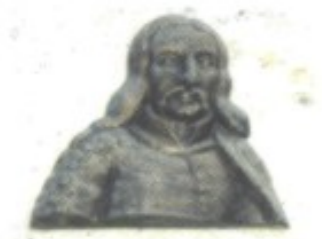
Franjo Krsto Frankopan wurde 1671 wegen seiner führenden Rolle bei der Verschwörung gegen die Habsburger in Wiener Neustadt hingerichtet. Im Bild: Gedenkmedaillon im Dorf Bosiljevo bei Karlovac