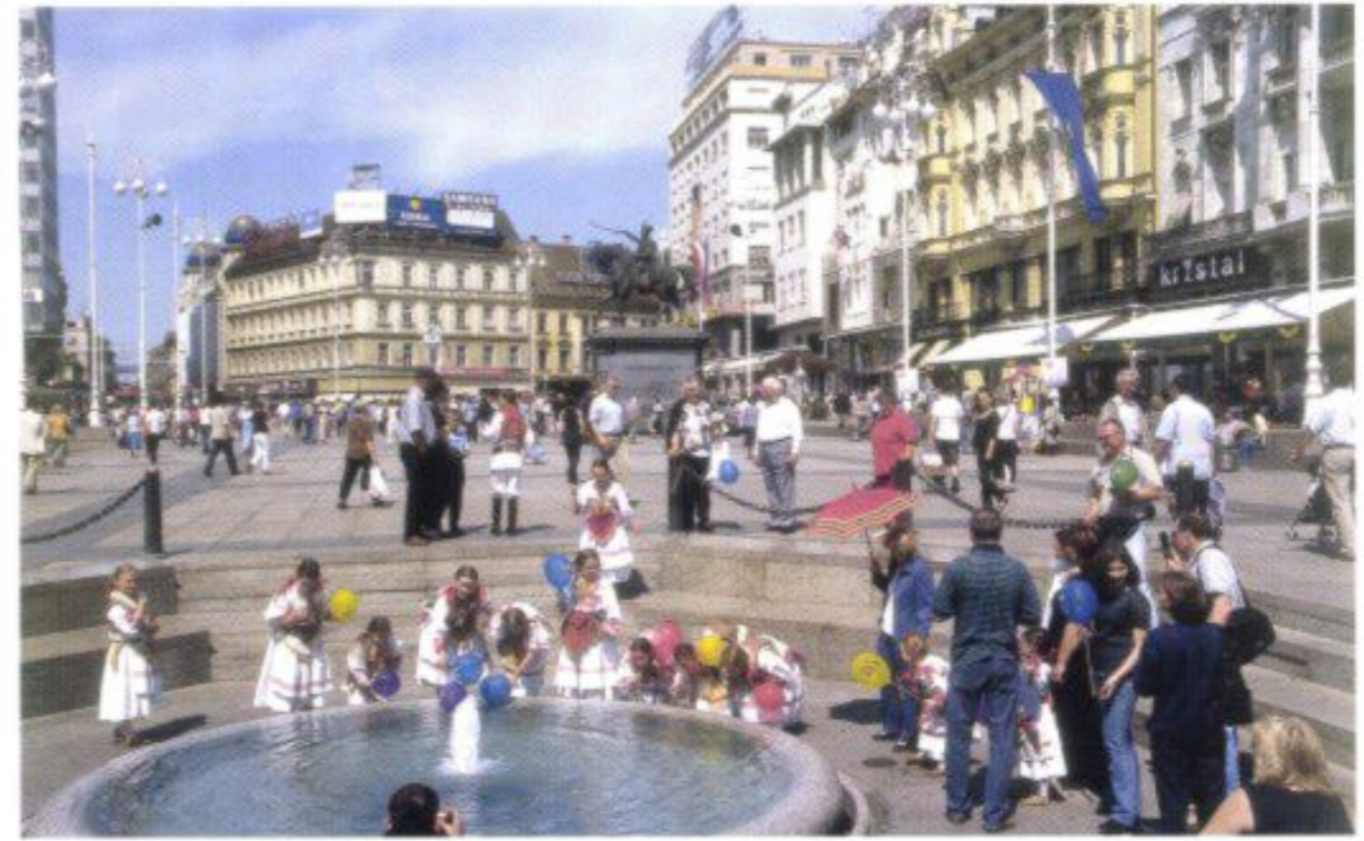
Beliebte Treffpunkte auf dem Platz des Banus Jelačić sind der Brunnen und, seit seiner Wiederaufstellung 1991, das Reiterstandbild des Namenspatrons.

haft gestalteten Stadtmuseum [2] im ehemaligen Klarissenkloster nachvollziehen. Auf dem Weg dorthin, in den nordöstlichsten Zipfel der Oberstadt, gilt es freilich eine ganze Reihe anderer, für das Selbstverständnis der heutigen Zagreber wichtiger Stätten zu besichtigen: Um, aus dem neuzeitlichen Stadtzentrum kommend, den Hügel von GORNJI GRAD zu erklimmen, empfiehlt sich die Treppe am Ende des Gässchens Tomičeva oder, bequemer, parallel die kurze Fahrt mit der sympathisch altertümlichen Zahnradbahn [3]. Oben angekommen, genießt man zuerst einmal den schönen Stadtblick, während man ein Stück weit die von Kastanien gesäumte Strossmayer-Promenade entlang flaniert (nicht erschrecken, wenn exakt zur Mittagsstunde aus dem nahen Aussichtsturm Lotrščak über dem ehemaligen Stadttor Dverce ein Kanonenböller erschallt!). Ein Schlenker nach rechts führt über den Katharinenplatz , vorbei an der gleichnamigen Barockkirche , dem Museum für Zeitgenössische Kunst [4] und Zagrebs erstem, dem 1607 gegründeten Gymnasium, weiter über den Jesuitenplatz (besuchenswert: das Kultur- und Galeriezentrum Klović-Höfe!) und durch die Vitezovičeva in die Ćirilometodska. Hier hat jedes Haus eine spezielle Geschichte zu erzählen: Auf Nr. 3 sind auf Dauer Werke der Naiven Malerei [5], vornehmlich der „Schule von Hlebine“ (vgl. Route 2), zuhause. Neben an, im heutigen Rathaus, war das erste Theater der Stadt untergebracht, hier wurden sowohl