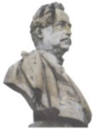
Ljudevit Gaj, der Kopf des so genannten Illyrismus, lieferte mit seinen Schriften der kroatisch-nationalistischen Bewegung ihre ideologische Grundlage. Im Bild: Büste in seinem Geburtsort Krapina.

1814/1815ff. Auf dem Wiener Kongress unterstützen die Kroaten das Bestreben Österreichs, sämtliche Gebiete der Illyrischen Provinzen zurückzuerhalten. Damit sind erstmals seit dem Mittelalter wieder alle Kroaten in einem Staat vereint.