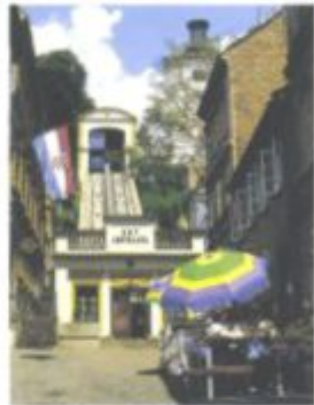
Der bequemste Weg von der Unter- in die Oberstadt führt per Zahnradbahn durch die Tomićeva.

Dabei genügt schon ein Blick aus der Vogelperspektive, um zu erkennen, was für städtebaulicher Schatz hier, eingerahmt vom Fluss Save und dem Medvednica-Berg, seiner Entdeckung harret. Vom Aussichtsbalkon des Lotrščak-Turmes [1] zum Beispiel, einem Relikt der mittelalterlichen Befestigungsanlage, präsentieren sich die drei Bezirke des historischen Zentrums wie auf dem Servierbrett: die bürgerliche, einst durch eine Burg geschützte Oberstadt namens Gornji Grad ; vis-à-vis, von der neogotischen Kathedrale überragt, das bischöfliche Kaptol , und zu Füßen der beiden Hügel die Unterstadt ( Donji Grad ) – das im späten 19. Jahrhundert schachbrettartig angelegte, von viel Grün durchsetzte altneue Zagreb.