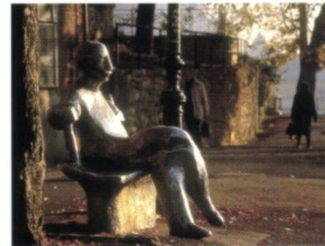
Auf der Strössmayer-Promenade erinnert eine Ende der 1970er Jahre gegossene Bronzefigur an den Schriftsteller Antun Gustav Matoš.

Natürlich reichen die Wurzeln Zagrebs weit in vorhabsburgische Zeiten zurück: Etliche Zeugnisse, unter anderem Opferaltäre, Statuen, Grabsteine, belegen eine Besiedlung in der Antike, und Funde unter den Grundmauern des Städtischen Museums (Grabungsstätte besichtigbar!) stammen sogar aus der Bronzezeit. Fest steht, dass auf dem Gebiet ein illyrischer Stamm namens Andautonier lebte. Und stark vermutet wird auch, dass nach den großen Völkerwan-