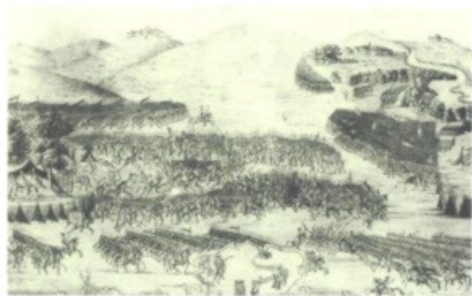
Der Sieg der Türken über Serben und Bosnier auf dem Amsselfeld (im Bild: zeitgenössische Darstellung) hatte auch auf die Geschicke Kroatiens nachhaltige Auswirkungen.

tigen Macht- und Kulturzentrum. Erst 1808 wird die Stadt im Zuge der napoleonischen Kriege ihren Status als freies Territorium wieder verlieren.