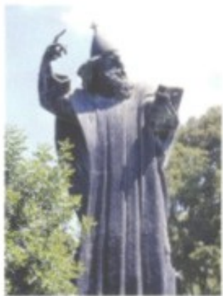
Grgur Ninski, der dritte Bischof von Nin (im Bild: Denkmal in Split), setzte um 900 als Oberhaupt aller kroatischen Christen die Anwendung der glagolitischen Liturgie durch.