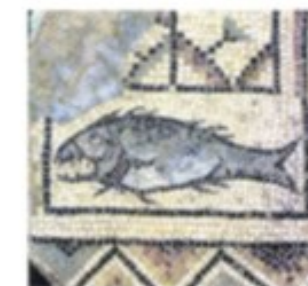
Typisch für die spätchristliche Zeit: Fischsymbol in einem Mosaik der Euphrasius-Basilika im istrischen Poreč.