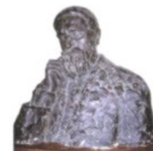
Diese Büste, ein Selbstporträt des mit Abstand prominentesten kroatischen Bildhauers der Moderne, steht im Ortsmuseum von Drniš, in dessen Nähe Ivan Meštrović seine Kindheit zubrachte.