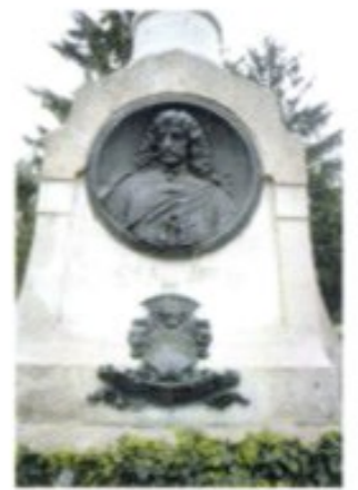
Graf Nikola von Zrinski (1620–1664) war Dichter, Banus von Kroatien und ein erfolgreicher Kämpfer gegen die Türken. Im Bild: Denkmal in Čakovec, seinem Sterbeort.

1809 Im Frieden von Schönbrunn verliert Österreich sämtliche Gebiete südlich der Save bis zur Mündung der Una an Frankreich. Napoleon richtet die Illyrischen Provinzen ein, deren Hauptstadt erst Ljubljana, dann Triest ist. In den fünf kurzen Jahren der französischen Herrschaft werden eine Reihe wirtschaftlicher und rechtlicher Reformen in Angriff genommen, die in der Bevölkerung tiefen Eindruck hinterlassen.