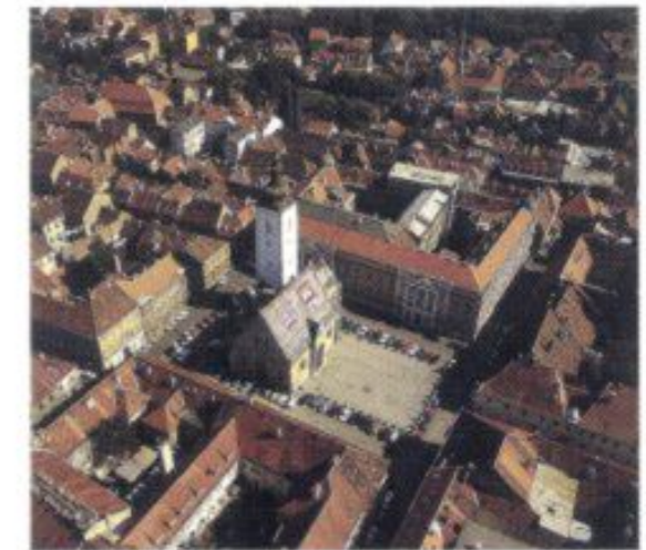
Mittelpunkt der Oberstadt: Der Markusplatz mit der gleichnamigen Kirche, die bereits Mitte des 13. Jh. erstmals urkundlich erwähnt wurde.

haft gestalteten Stadtmuseum [2] im ehemaligen Klarissenkloster nachvollziehen. Auf dem Weg dorthin, in den nordöstlichsten Zipfel der Oberstadt, gilt es freilich eine ganze Reihe anderer, für das Selbstverständnis der heutigen Zagreber wichtiger Stätten zu besichtigen: Um, aus dem neuzeitlichen Stadtzentrum kommend, den Hügel von GORNJI GRAD zu erklimmen, empfiehlt sich die Treppe am Ende des Gässchens Tomičeva oder, bequemer, parallel die kurze Fahrt mit der sympathisch altertümlichen Zahnradbahn [3]. Oben angekommen, genießt man zuerst einmal den schönen Stadtblick, während man ein Stück weit die von Kastanien gesäumte Strossmayer-Promenade entlang flaniert (nicht erschrecken, wenn exakt zur Mittagsstunde aus dem nahen Aussichtsturm Lotrščak über dem ehemaligen Stadttor Dverce ein Kanonenböller erschallt!). Ein Schlenker nach rechts führt über den Katharinenplatz , vorbei an der gleichnamigen Barockkirche , dem Museum für Zeitgenössische Kunst [4] und Zagrebs erstem, dem 1607 gegründeten Gymnasium, weiter über den Jesuitenplatz (besuchenswert: das Kultur- und Galeriezentrum Klović-Höfe!) und durch die Vitezovičeva in die Ćirilometodska. Hier hat jedes Haus eine spezielle Geschichte zu erzählen: Auf Nr. 3 sind auf Dauer Werke der Naiven Malerei [5], vornehmlich der „Schule von Hlebine“ (vgl. Route 2), zuhause. Neben an, im heutigen Rathaus, war das erste Theater der Stadt untergebracht, hier wurden sowohl