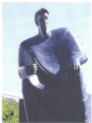
König Petar Krešimir IV. vereinte Mitte des 11. Jh. Kroatien und eroberte die dalmatinischen Inseln.

812 Im Frieden von Aachen zwischen Karl dem Großen und dem byzantinischen Kaiser Michael I. werden die kroatischen Gebiete dem Frankenreich unterstellt.