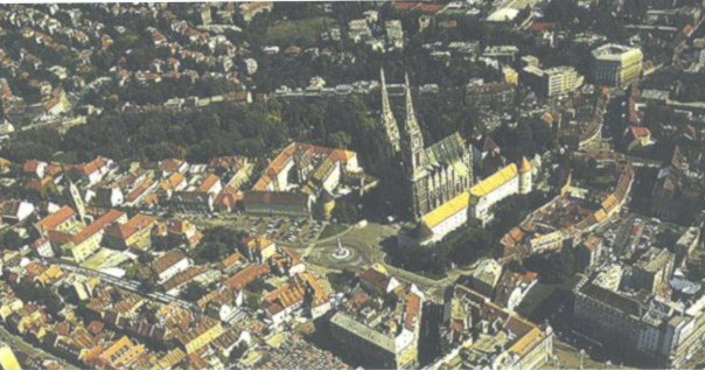
Kaptol, seit alters das klerikale Herz der kroatischen Hauptstadt, mit der Kathedrale aus der Vogelperspektive.