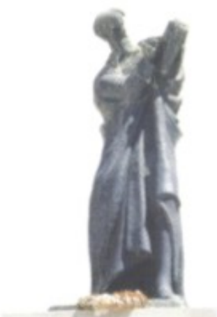
Kein Geringerer als Ivan Meštrović schuf das Denkmal für den Dichter Marko Marulić, das auf dem Trg Braće Radica, dem Obstplatz, in der Spliter Altstadt steht.