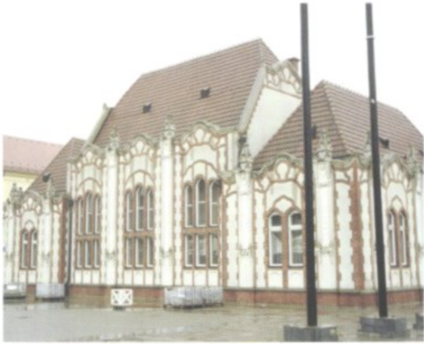
Das so genannte Handelscasino im verkehrsbefreiten Zentrum von Čakovec – ein Werk des Architekten Ödön Horvath im ungarischen Jugendstil.