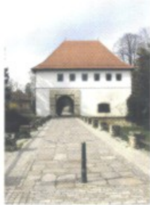
Ein kurzer, flacher Fußweg führt von der Stadt durch ein wuchtiges Wächterhaus zur Burg.

Zur Römerzeit bestand der Ort nur aus ein paar Villen – eine unbedeutende Station auf der Fernstraße von Poetovio, dem heutigen Ptuj, nach Mursa (Osijek). Wichtiger waren schon damals die nahen Bäder von Aquae Iasae (s. Kasten S. 57). Urkundlich erstmals erwähnt wird Varaždin 1181 in einem Dokument von Bela II. Eine Generation später (1209) ist es bereits freie Königsstadt und bald darauf ein florierendes Handelszentrum. Seine höchste Blüte erlebt es im 17. und 18. Jh. Damals lassen Jesuiten, Franziskaner, Ursulinen und andere Orden, beschwingt vom