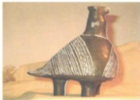
Die „Tauben von Vučedol“ – berühmtestes Objekt aus der Fundstätte bei Vukovar.