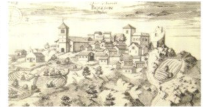
Ansicht von Boljun aus dem Spätmittelalter: Istriens Bergkuppen zieren über 130 solcher Burgstädtchen, von denen viele seit 3000 Jahren besiedelt sind.

1382 Dubrovnik erwirbt durch einen Vertrag mit Ungarn seine Unabhängigkeit und entwickelt sich als Republik Ragusa zu einem wich-