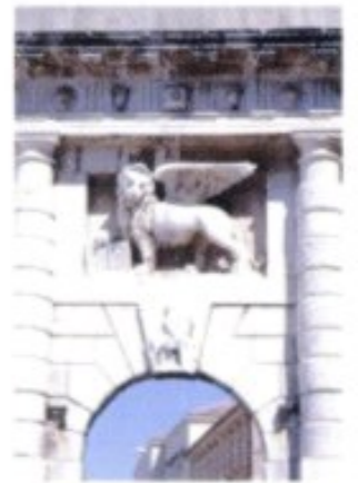
Das Landtor, Mitte des 16. Jh. von Michele Sanmicheli am Ostrand der Altstadt von Zadar errichtet, trägt, wie viele Wehr- und Repräsentationsbauten aus jener Zeit entlang der östlichen Adriaküste, das unübersehbare Machtsymbol der Serenissima.