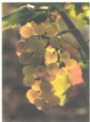
Den nördlichsten Zipfel Kroatiens erkundet man am besten auf der Vinska Cesta, der „Weinstraße des Medjimurje“.

Weinliebhabern sei die Fahrt durch die malerischen Hügel nahe der slowenischen Grenze entlang der von Winzerdörfern und Verkostungsstellen gesäumten Weinstraße des Medjimurje wärmstens empfohlen.