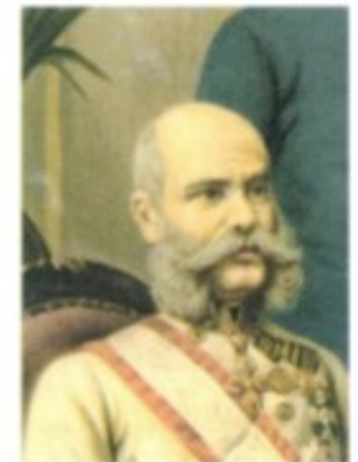
Kaiser Franz Joseph I. – seit seiner Thronbesteigung nach der Revolution von 1848 war er auch für viele Kroaten verhasstes Symbol der habsburgischen Hegemonie.

1867 Mit dem Ausgleich zwischen Österreich und Ungarn erlangen die Magyaren innerhalb der Monarchie Sonderrechte. Vor allem ist es Wien von nun an unmöglich, innenpolitische Entscheidungen Un-