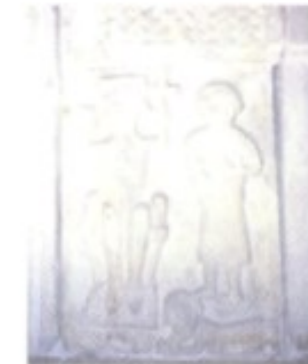
Das Taufbecken im ehemaligen Jupitertempel in Split (9. Jh.) ist mit Flechtwerk und dem Relief eines kroatischen Königs verziert.

9. Jh. Von Osten kommend dringen die Ungarn nach Pannonien vor und vertreiben sukzessive die slawischen Stämme.