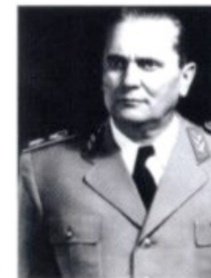
Josip Broz alias Tito: Für fast vier Jahrzehnte die prägende Figur der jugoslawischen Politik mit immenser Außenwirkung.