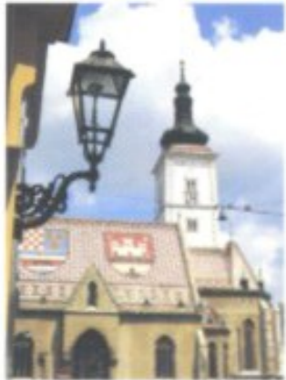
Auf dem Dach der Markuskirche wurden 1882 mit glasierten Ziegeln die Wappen Kroatiens, Dalmatiens und Slawoniens sowie Zagrebs verlegt.