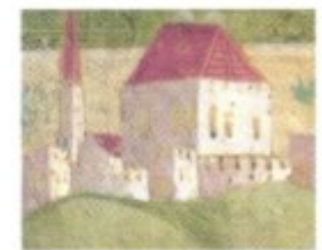
Auch auf den berühmten Fresken des Vinzenz von Kastav in der Marienkirche bei Beram (spätes 15. Jh.) finden sich istrische Wehrstädte abgebildet.