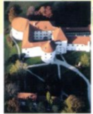
Aus der Vogelperspektive ist etwas besser zu erahnen, dass sich hinter dem wehrhaften Äußeren der Varaždiner Burg ein Renaissancepalast verbirgt.

Siegeszug der Gegenreformation, eine Reihe stattliche Sakral- und Schulbauten errichten. Viele Adelsfamilien schaffen sich prachtvolle Paläste. Und 1756 wird Varaždin, das schon seit dem 16. Jh. Sitz eines Generalats der Militärgrenze ist, für zwanzig Jahre, bis zur großen Feuersbrunst, Sitz des kroatischen Banus, in der Folge auch des königlichen Rates und somit Hauptstadt Kroatiens.