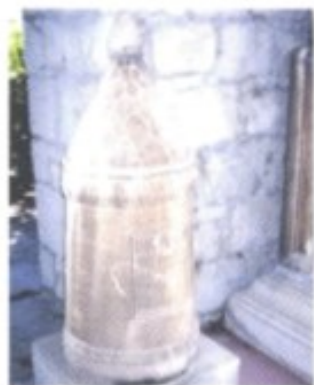
Liburner-Grabstein (um 1.000 v. Chr.) im Archäologischen Museum von Split.